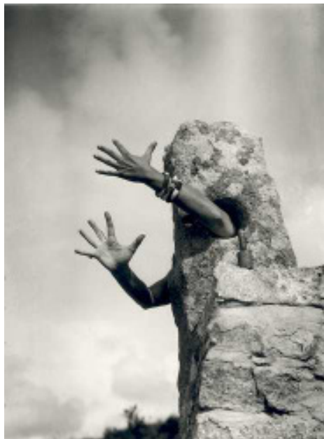
I extend my arms, 1920