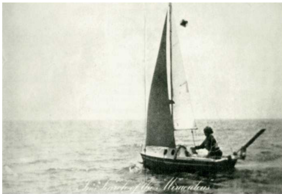
Detalhes de In Search of the Miraculous , 1975