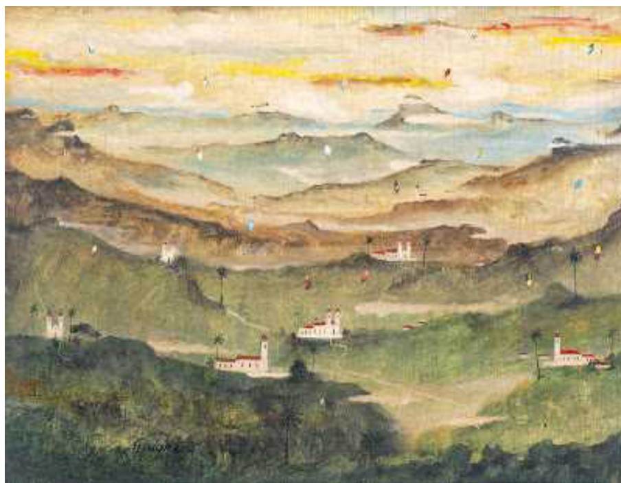
Paisagem Onírica de Ouro Preto, 1960