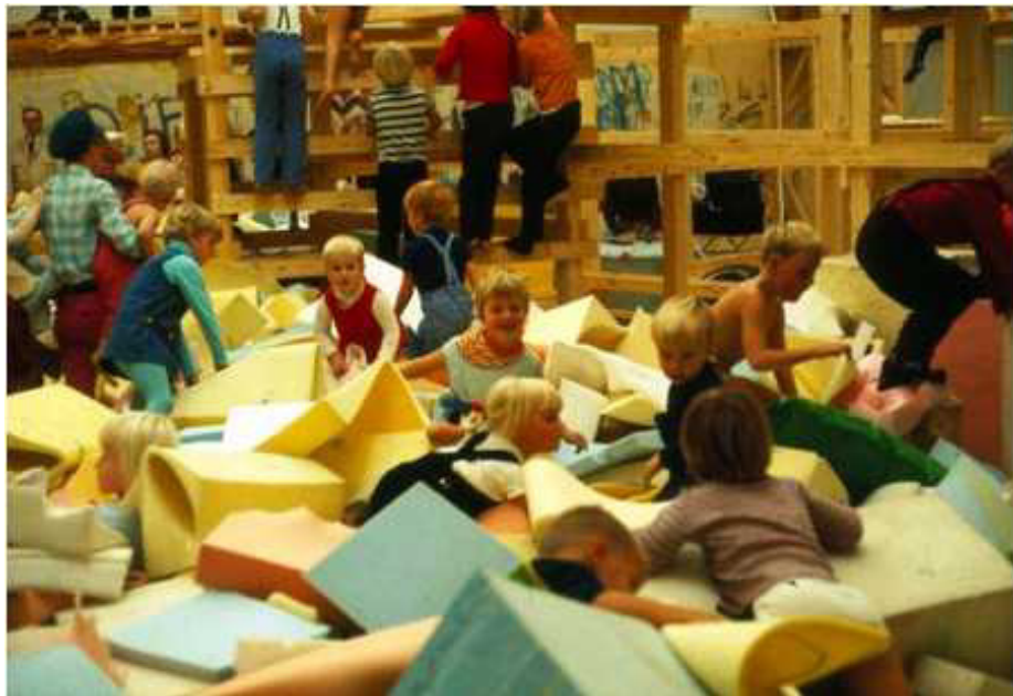
The Model – A Model for a Qualitative Society, 1968