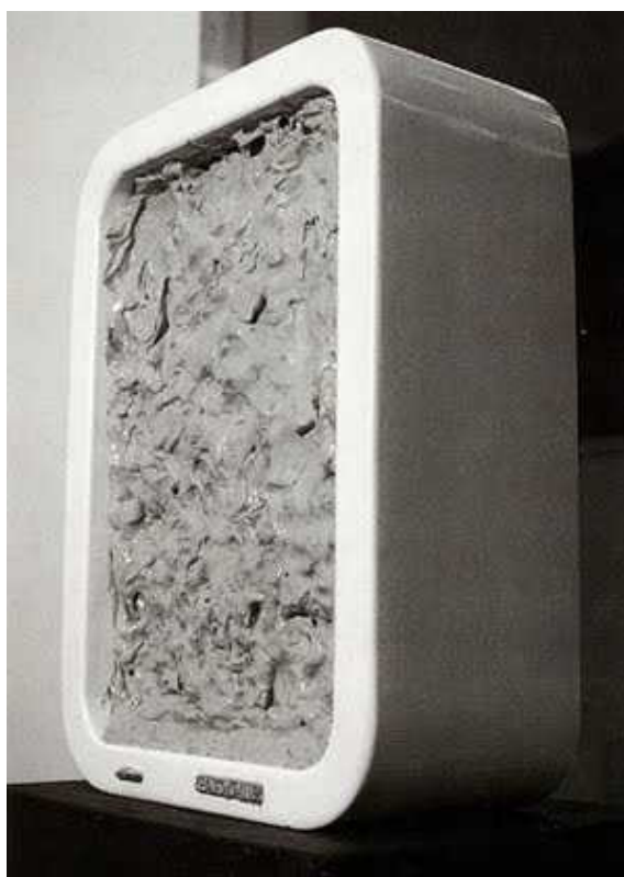
Espelho Cego, 1970