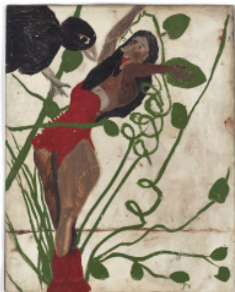
Woman and Giant Bird