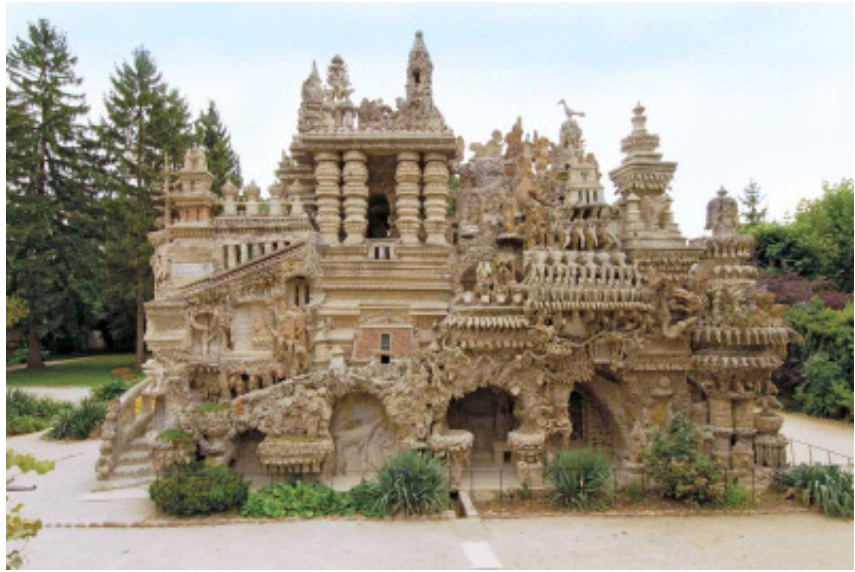
Palais Idéal, 1879-1912