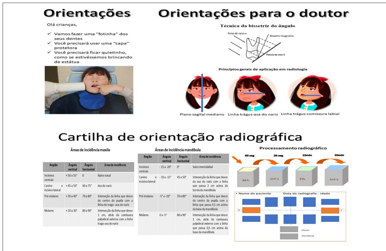
Figura 1 - Cartilha de orientação radiográfica