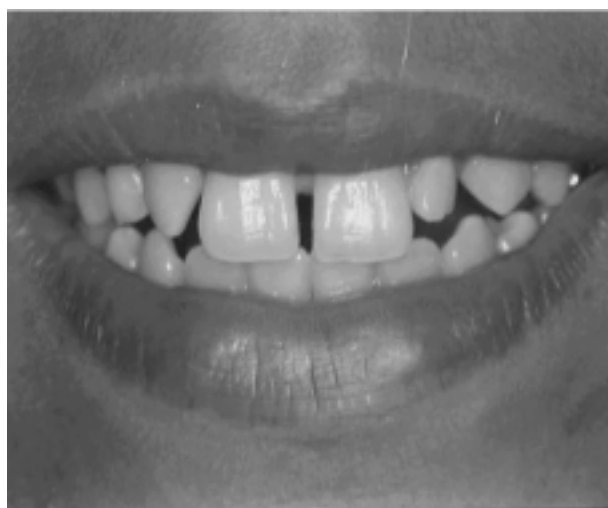
Figura 1. Sorriso inicial da paciente

Paciente do sexo feminino, 13 anos de idade foi atendida no curso de Atualização de Saúde e Estética em Dentística na UNESA. Foram diagnosticados anodontia do elemento 12, diastema entre os elementos 11 e 21 e o elemento 22 conóide. A paciente sentia-se profundamente incomodada com a forma e a disposição de seus dentes e mostrava-se retraída e constrangida ao sorrir (Figura 1).