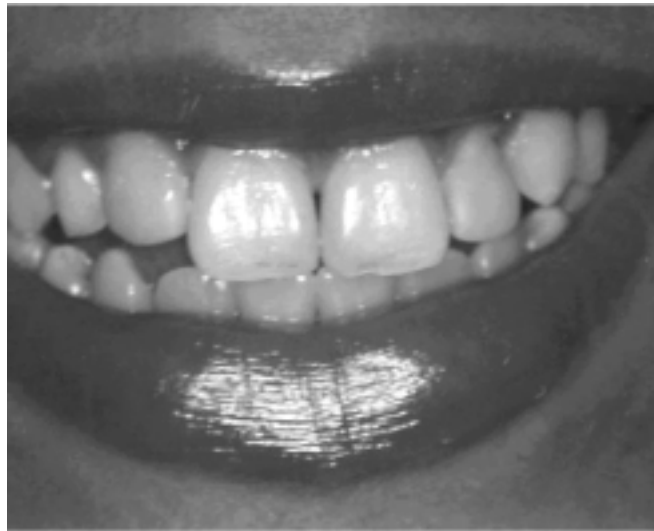
Figura 3. Sorriso final da paciente

ângulo méso-incisal foi recoberto com resina para que o mesmo tomasse a forma característica de um incisivo lateral (Figura 3).