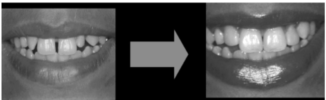
Figura 4. Comparação do sorriso inicial e final da paciente

Para o acabamento, foram utilizadas pontas diamantadas de diversos formatos (KG Sorensen), tiras de lixa para acabamento de resina (3M) nas interproximais, discos Sof Lex Pop On (3M) em todas as cores (granulações) de azul, sendo que as menores granulações serviram para o polimento final. Também foram utilizados pasta para polimento Profill (SSWhite) e discos de feltro (Kota). Podemos comparar o sorriso inicial e final da paciente na Figura 4.