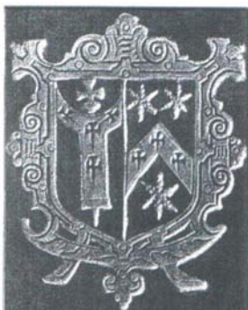
Figura 3 - Brasão do Arcebispo Laud 28

O couro do lombo da capa está gasto, sendo possível visualizar, na parte superior, que após a camada de couro, há camadas de papel. Esse couro do lombo apresenta nervos e relevos decorativos na horizontal. Há duas etiquetas de papel coladas no lombo: uma de 23 mm por 20 mm, na qual se encontra escrito, em caracteres latinos <Laud / B / [...]>, 29 aproximadamente no meio do lombo; outra de 15 mm por 21 mm, na qual se encontra escrito, em caracteres arábicos <282>, encontrada na parte inferior do lombo.