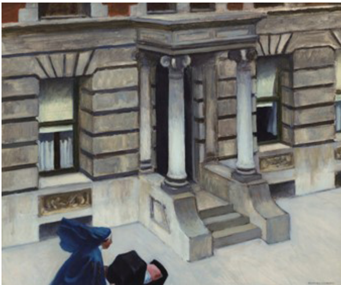
Óleo sobre tela, 61 x 73,7 cm, Norfolk (VA), The Chrysler Museum, doação de Walter P. Chrysler Jr., 83.591.

Figura 9 – Edward Hopper, New York Pavements , 1924.