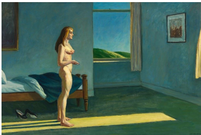
Óleo sobre tela, 101,6 x 152,4 cm, Nova York (NY), Whitney Museum of American Art.

É natural, nesse movimento de leitura, buscar por similaridades e pontes entre texto e tela, e nessa busca podemos encontrar “referências” e “contágios”, para usar dos termos da nota inicial, que ecoam do pictural para o verbal: o céu azul que se confunde com a cor das paredes do quarto, a porção de verde do campo ao fundo, o lume solar a invadir o espaço. Entretanto, Magalhães dá a essa cena uma nova vida, confere-lhe um passado, uma circunstância um tanto abstrata, mas captável pelas janelas que o poema deixa entreabertas: a separação, a solidão, a resiliência perante as adversidades da vida, em suma, o poema opera a partir de uma ausência sentida também na pintura. Nesse sentido, podemos dizer, com Márcia Arbex (2013, p. 25) – e Mourier-Casile e Moncond’huy (1996) ao fundo –, que “A imagem é, sobretudo, um dispositivo próprio a gerar a ficção, instalando por vezes a ficção no cerne da imagem”.