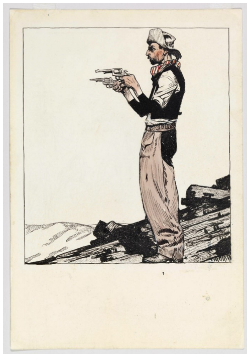
Figura 4 – Edward Hopper, Cowboy , c. 1906-1914.

Pincel, nanquim e aquarela transparente e opaca sobre papel, 55,1 x 37,8 cm, Nova York (NY), Whitney Museum of American Art.