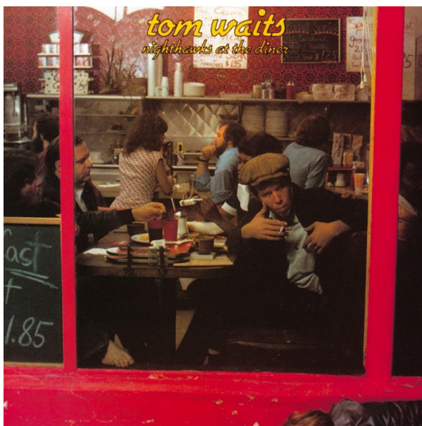
Figura 6 – Tom Waits, Nighthawks at the diner , Asylum Records, 1975.

Vejamos então o poema na íntegra e, na sequência, a tela de 1942 de E. Hopper: