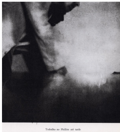
Figura 1 – Fotografia de Jorge Molder (1980, p. 35)

Todavia, antes de ir aos poemas selecionados dos dois poetas, é importante destacar o papel desempenhado pelas fotografias de Jorge Molder nesse livro-objeto. Dispostas como eixo central que se interpõe às duas seções de poemas, a de Fernandes Jorge que abre e a de Magalhães que encerra o volume, essas fotografias de Molder – quem, de acordo com Magalhães, em um texto (1989/90) que busca recordar os acontecimentos acerca do referido livro, foi o responsável pela ideia de produzir uma obra em diálogo com Edward Hopper –, usam e abusam do preto & branco, do contraste entre sombra e luz, de espaços vazios e noturnos, de janelas, portas e vidros, de figuras incógnitas. Veja-se 3 , de modo a materializar visualmente esses aspectos, as seguintes reproduções de fotografias de Molder: a primeira da série, em que a legenda dá a ver a ideia do personagem assinalado na nota de abertura; a que também figura na capa do livro – porque claramente remete para a mais famosa tela de Hopper, “Nighthawks”, que posteriormente irá aqui ser exposta e comentada; e, por fim, uma terceira para corroborar o ambiente soturno acima descrito.