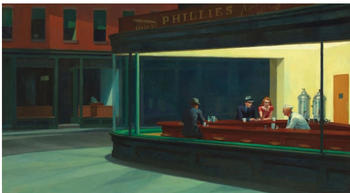
Óleo sobre tela, 76,2 x 144 cm, Chicago, The Art Institute of Chicago, Coleção dos Amigos da Arte Americana.

Notemos desde logo que a tela de Hopper é um dos pontos de partida para o poeta estabelecer pontes com o mundo “real”, palavra que irá perseguir e atormentar a poética de Freitas 5 , mundo este reconstruído e recodificado poeticamente no poema. Segundo o pintor,