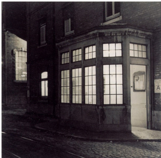
Figura 3 – Fotografia de Jorge Molder (SENA, 1998)