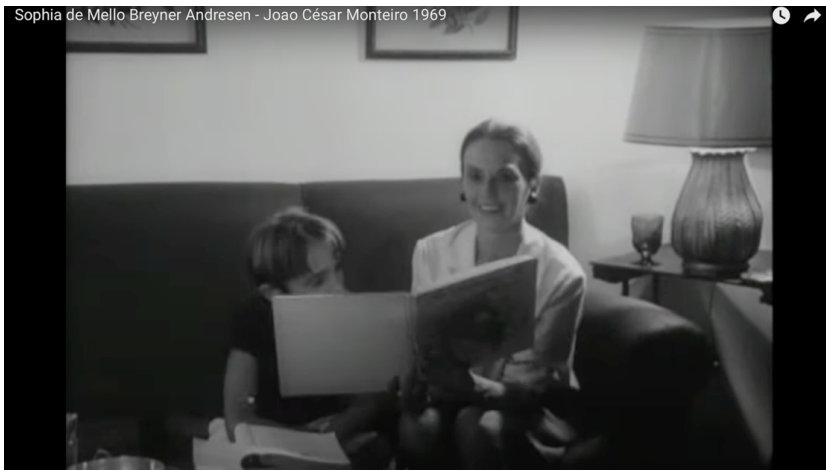
Figura 2 – Frame do filme Sophia de Mello Breyner Andresen , de João César Monteiro