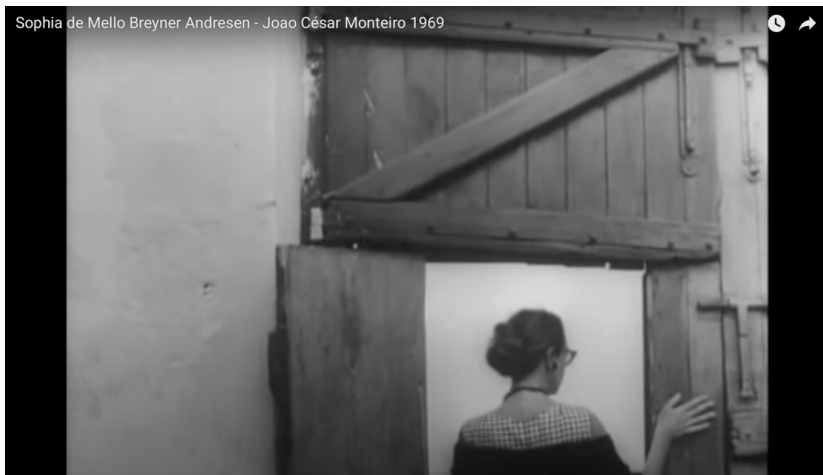
Figura 4 – Frame do filme Sophia de Mello Breyner Andresen , de João César Monteiro