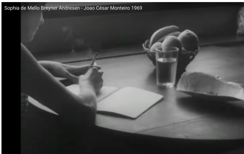
Figura 1 – Frame do filme Sophia de Mello Breyner Andresen , de João César Monteiro

Fonte: YouTube. Disponível em: https://www.youtube.com/watch?v=VDilav1fgzo . Acesso em: 8 jun. 2023.