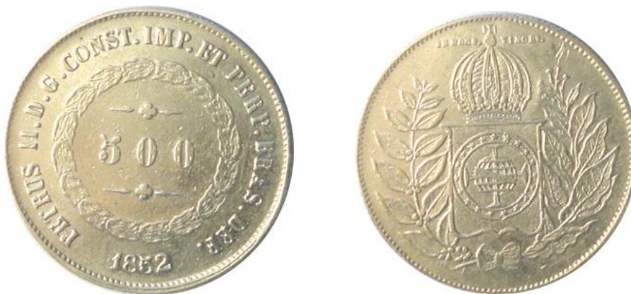
Figura 3- Moedas de prata- In hoc signo vinces

Como destaque adicional deste “lugar de memória” (NORA, 1993), remete aos emblemas em latim. O quadro comemorativo recupera a frase em latim, publicada 14 dias antes na revista Semana Ilustrada , com o acréscimo de uma nova divisa: In hoc signo vinces . Localizada sobre o brasão do Estado Imperial, entre a imagem do Imperador e a palavra liberdade, essa frase também foi grafada nas moedas de prata brasileiras do Império do Brasil, com diversos valores; multiplicando indefinidamente a mensagem em um suporte não descartável. Em uma face, a figura do imperador. Na outra, o brasão e a divisa ilustrada, que procura sintetizar uma espécie de destino do regime: vencer!