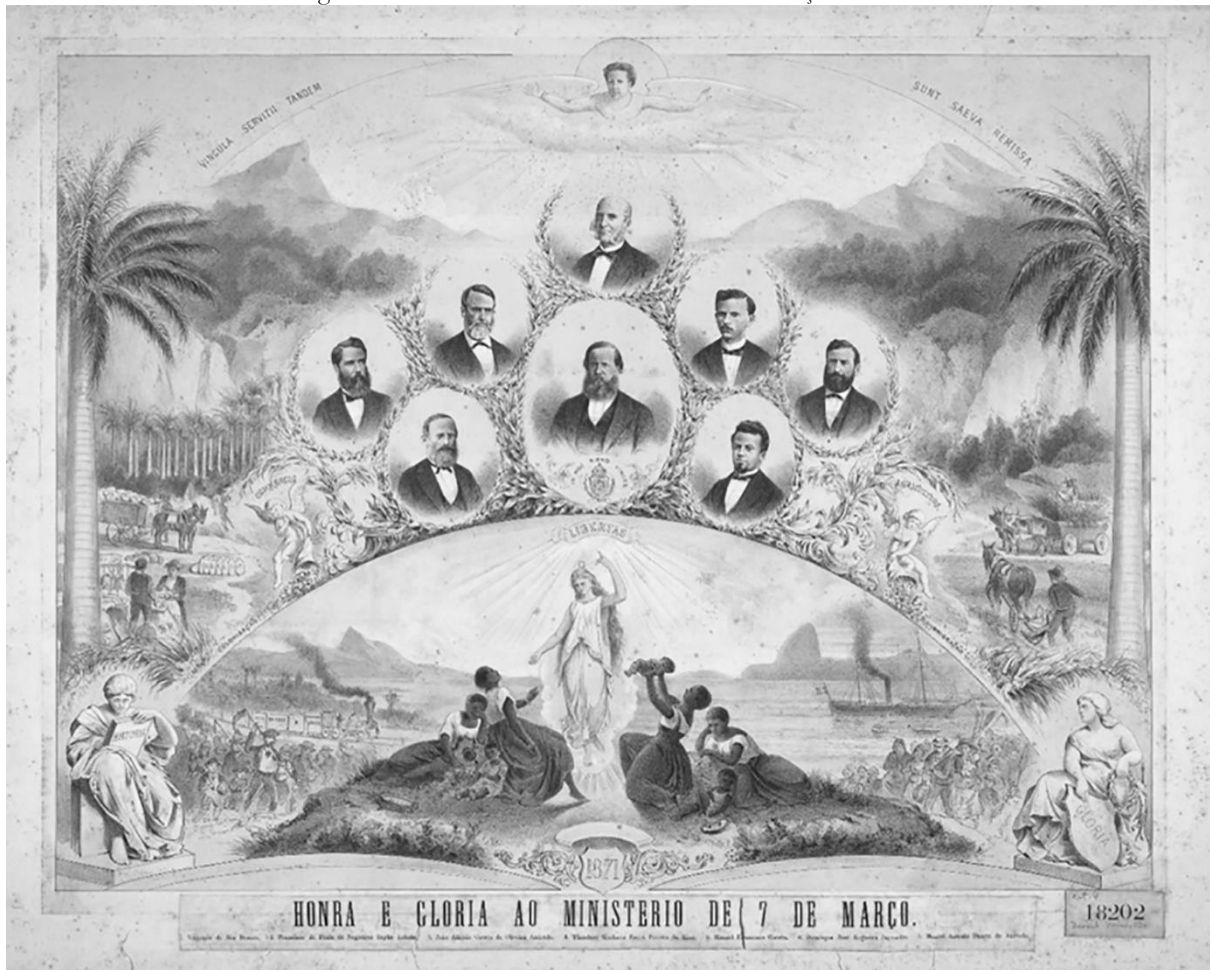
Figura 2 - Honra e Glória ao Ministério 7 de Março de 1871.