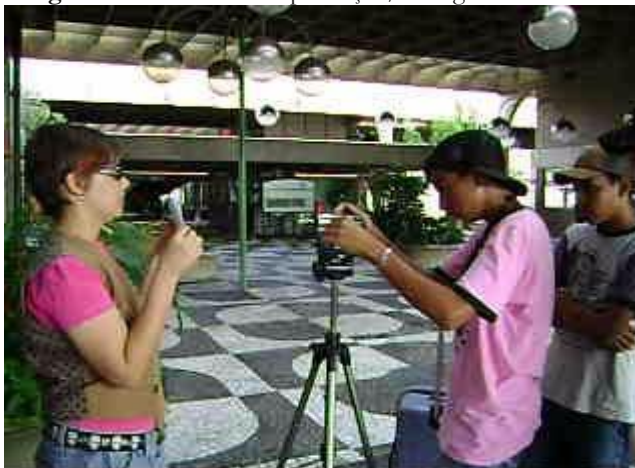
Figura 1 – Atividades de produção/filmagem dos roteiros

Finalmente, nas atividades de produção midiática, os participantes partem para manipular, na prática, elementos da linguagem audiovisual e das estruturas narrativas voltadas para um público específico. Técnicas pedagógicas como tradução, simulação e produção são postas em prática – e é aqui que se recorre a praticamente todos os conceitos-chave da mídia-educação nessa atividade. Com o público de alunos e professores, que focaram mais os filmes e as novelas, foi proposta a elaboração de pequenos curta-metragens de situações cotidianas na escola, mas cada grupo teria que elaborar um final diferente, de acordo com a audiência pretendida e o gênero abordado.