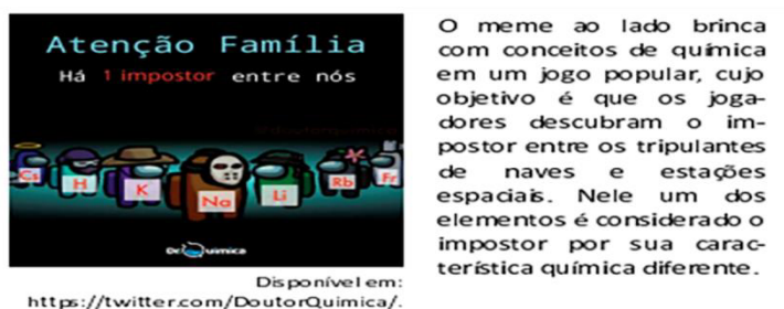
Figura 4 – Meme-4 presente na prova de conhecimentos gerais, 1ª fase, do vestibular da Fuvest/USP 2021

Nesse contexto, é correto afirmar que o impostor seria o elemento: