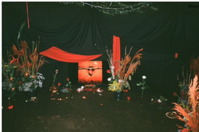
Figura 2 — Instalação Nada aqui se acaba

com o seu corpo e com a sua ancestralidade. Nada aqui se acaba é apresentado pela artista como um espaço perecível de liberdade e de experiência de cura que se baseia na criação de um ambiente encruzilhada, no qual os chacras básico, sexual e plexo solar são colocados em destaque e o encontro com eles ocorre por meio de poemas, sons e imagens.