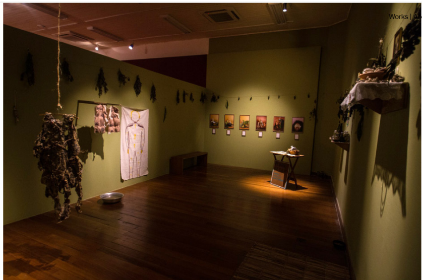
Figura 3 — Instalação Quarto de Cura

delas, estratégias de sobrevivência e imersão na vida. Além disso, a ancestralidade também é observada no movimento de retorno de Castiel e na vontade dela de estar com os seus, após tempos afastada de sua origem.