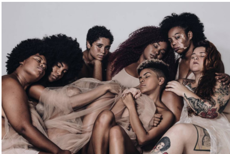
Figura 5 — Casa corpo pele parede