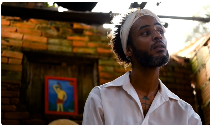
Figura 1 — Fonte de Cura — YouTube