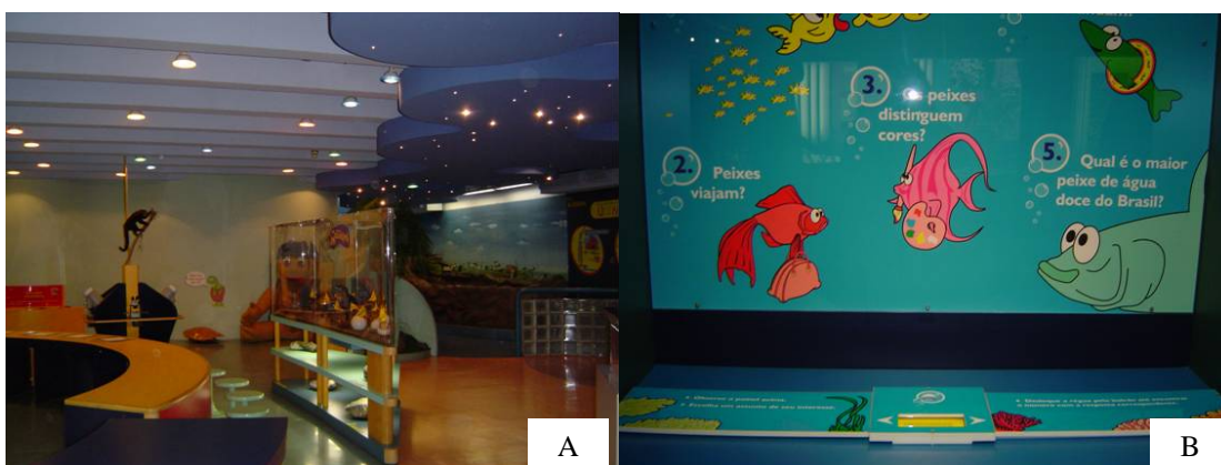
Figura 1. Vista parcial da mostra sobre Biologia no “Mundo da Criança” (A); Painel expositivo sobre a Biologia de peixes (B)

O layout da exposição de Biologia segue o mesmo formato de todas as exposições do museu. São utilizados painéis coloridos com ilustrações referentes ao tema e linguagem coloquial, com freqüente utilização de perguntas para despertar o interesse do público em relação ao material exposto (Figura 1B).