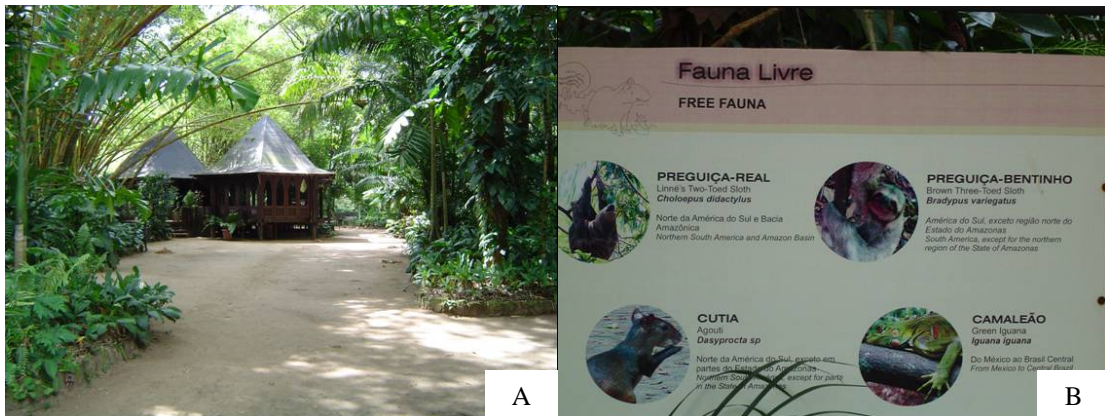
Figura 5. Trilha do “Parque Zoobotânico” (A); Painel expositivo com fotografias sobre a fauna livre do “Parque Zoobotânico” (B)

nome científico e popular das espécies e informações sucintas sobre distribuição geográfica, hábito alimentar e reprodução (Figura 5B). No aquário a observação dos organismos e das placas de identificação das espécies é difícil, em função do ambiente ser pouco iluminado. É possível encontrar facilmente monitores, que somente informam dados adicionais aos visitantes quando questionados.