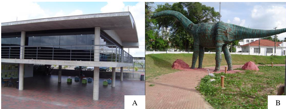
Figura 4. Vista parcial da sede do Espaço Ciência (A); Escultura de um dinossauro no “Parque da Descoberta Científica (B)

O Parque da Descoberta Científica utiliza como recurso de comunicação com o público visitante os próprios modelos e aparatos expostos, não havendo de forma geral, painéis explicativos e as informações são trabalhadas por monitores.