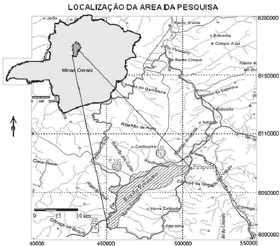
Figura 1 Localização geral da área da pesquisa no contexto geográfico municipal.

A área da pesquisa encontra-se regionalmente inserida na bacia hidrográfica do Rio São Francisco, mais especificamente no segmento Alto/médio curso, sendo a sub-bacia do Rio do Formoso a área efetiva da pesquisa (Figura 1).