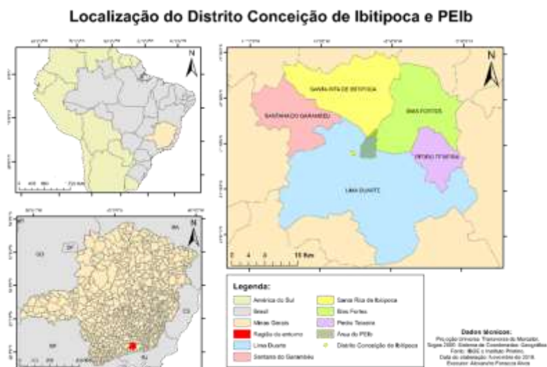
Figura 1- Localização do Parque Estadual do Ibitipoca

A única portaria de entrada do parque está situada a 2 quilômetros do Distrito de Conceição de Ibitipoca (pertencente ao município de Lima Duarte). Segundo IBGE (2010), em 2010, a população de Conceição do Ibitipoca era de 1.004 habitantes. Nas últimas décadas, tem recebido investimentos, tanto da iniciativa privada como de ações do poder público estadual, sobretudo, em relação à melhoria de infraestrutura de acesso, uso público e serviços destinados aos visitantes. Como consequência, o distrito tem vivenciado um cenário de crescimento econômico e aumento de geração de oportunidades de emprego e renda em virtude do surgimento e consolidação do setor de turismo, mais especificamente ao segmento do ecoturismo e turismo em áreas naturais, ancorados no principal atrativo turístico regional, o Parque Estadual do Ibitipoca. O distrito recebe ainda numerosos eventos, também com alto poder de atração de visitantes.