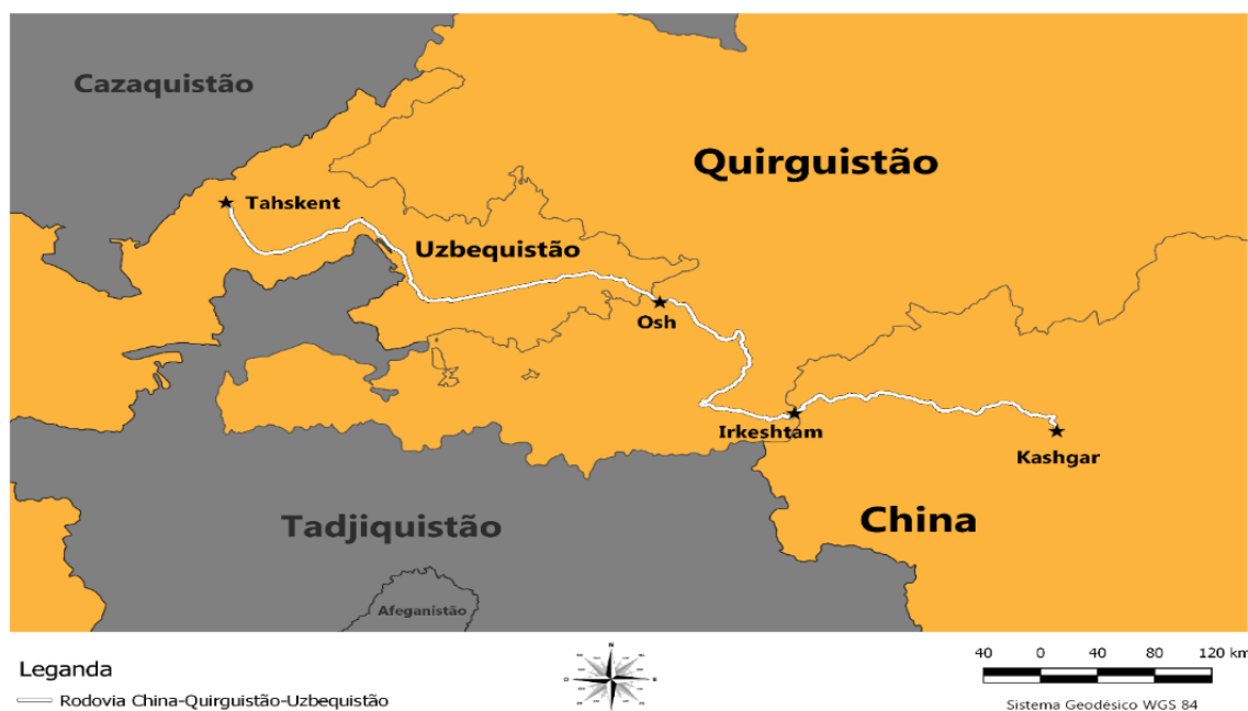
Mapa 3. Extensão total da rodovia China – Quirguistão – Uzbequistão.

A China Railway Construction Corporation finalizou, em 2016, a Vakhdad-Yovon railway , no Tadjiquistão 19 . A empresa também está empenhada em realizar a construção da antiga e desejada ferrovia ligando a China ao Uzbequistão, o que permitirá uma conectividade não somente entre os três países, alcançando também o Irã (via Turcomenistão) e a Turquia. Uma importante rota para a circulação e trânsito da produção chinesa em direção ao continente europeu. Outro benefício, é que tal rota poderia encurtar em alguns quilômetros e dias as jornadas dos trens que realizam a ligação entre a China e Europa pela New Eurasian Land Bridge (via Cazaquistão) 20 .