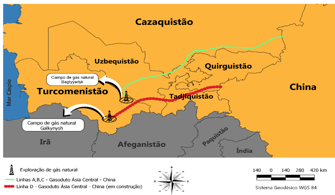
Mapa 2. Gasoduto Ásia Central – China e suas conexões com o território chinês