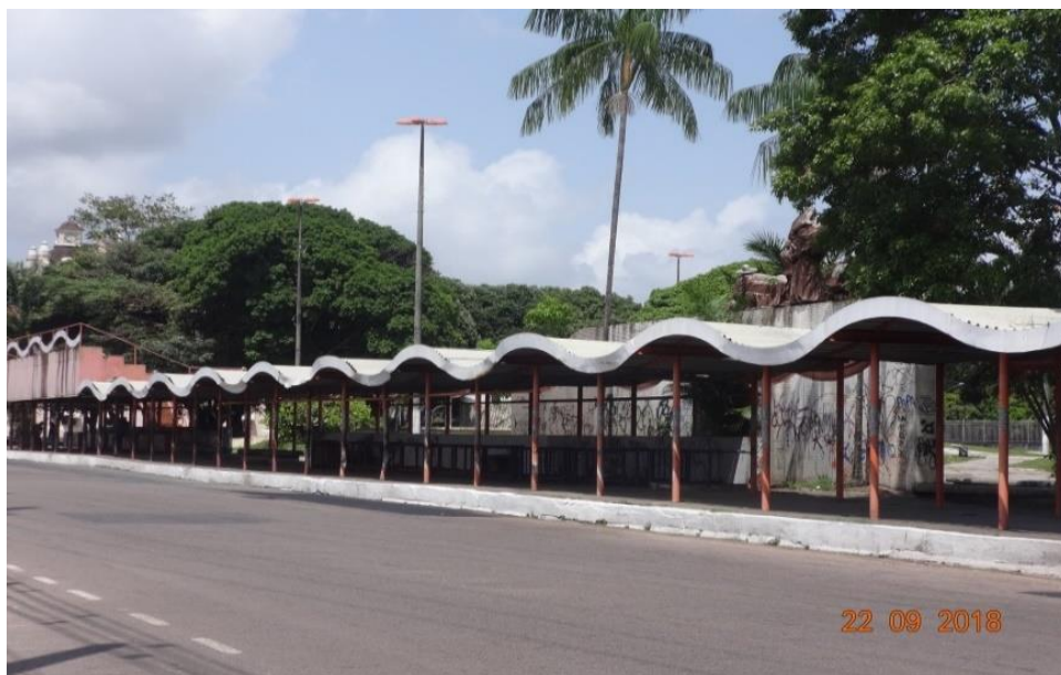
Fotografia 2. Terminal de passageiros e local destinado aos vendedores ambulantes.

Acrescentado à praça na reforma de 1999, o playground contendo brinquedos e calçadas com desenhos de notas musicais e estrofes que remetiam às composições do maestro Waldemar Henrique deixou de existir, permanecendo na praça apenas um escorregador. Há ainda um terminal de passageiros (Fotografia 2) de 90 metros quadrados que, na sua inauguração, abrigava 32 ambulantes, mas que até o mês de setembro de 2018 contava apenas com 1 ambulante.