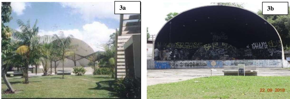
Imagem 3. Concha Acústica.