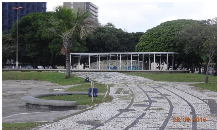
Fotografia 1. Palco em forma de teclas de piano de cauda.

Além disso, a estrutura da praça ainda recebeu um palco em forma de teclas de piano de cauda (Fotografia 1), representando um dos principais instrumentos utilizados pelo Maestro homenageado, e uma concha acústica (Imagem 3) em forma de cuia, instalada com o objetivo de impulsionar e promover apresentação de bandas musicais locais.