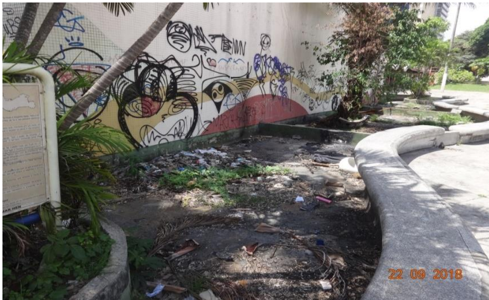
Fotografia 3. Área da Praça utilizada como depósito de lixo.