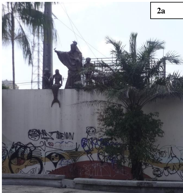
Imagem 2. Personagens folclóricos das lendas amazônicas representados na Praça