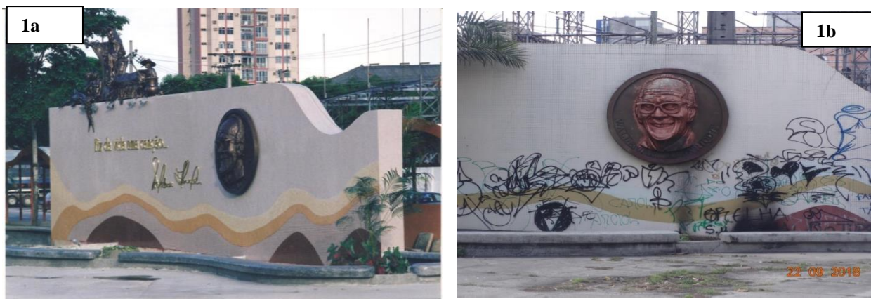
Imagem 1. Escultura do Maestro Waldemar Henrique