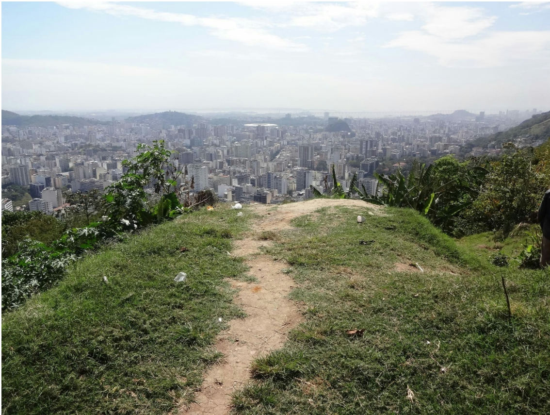
Foto 10: Foto da vista da trilha no Morro da Formiga.