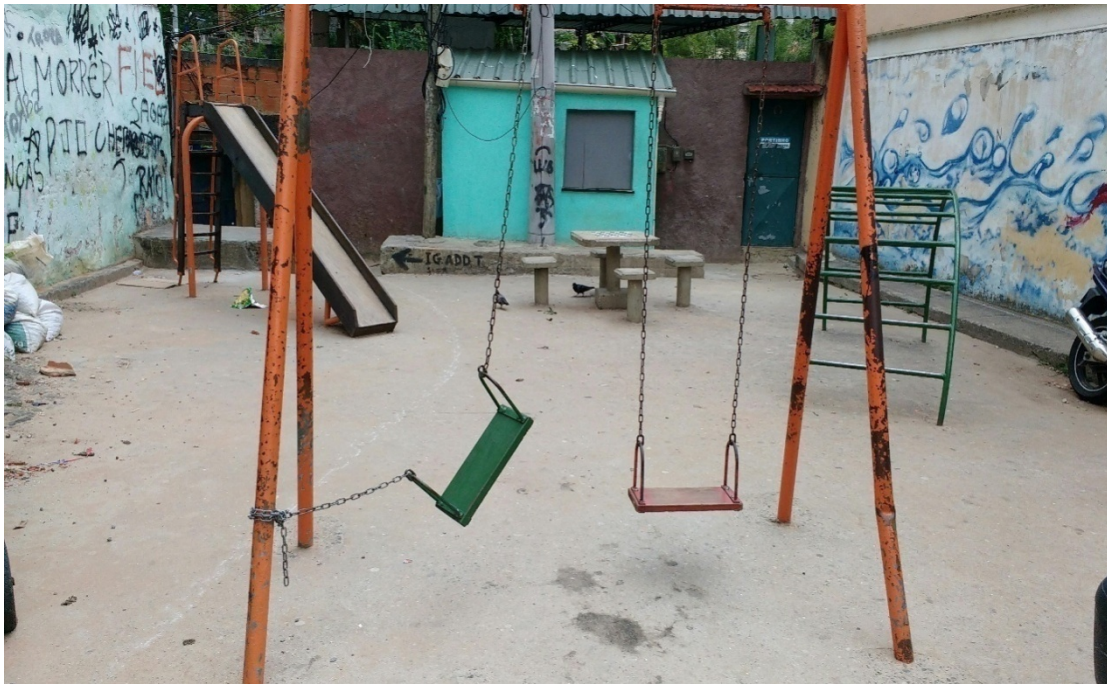
Foto 4: Foto tirada no dia 03/11/2017, motos estacionadas próximo dos equipamentos.

Foto 3: Foto tirada no dia 31/10/2017. Há concentração de lixo, não é gradeado, balanço com defeito e equipamentos enferrujados.