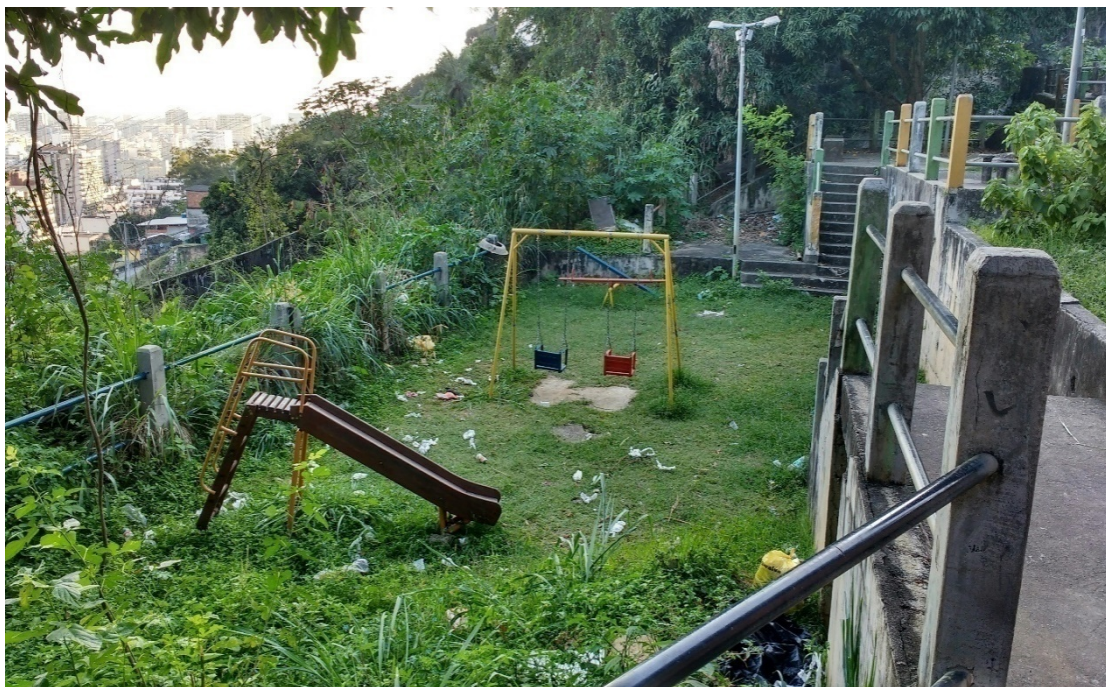
Foto 5: Foto tirada no dia 12/10/2017, falta de poda na grama, há concentração de lixo.

A praça da Cascata está localizada no Setor Cascata. Nela contém os seguintes equipamentos: uma gangorra dupla, um escorrega, um balanço duplo, dois conjuntos de banco e mesa com tabuleiro embutidos de dama/xadrez e dois bancos. Em seu entorno há quatro árvores e a cachoeira Cascata. O espaço apresenta avarias, dentre elas: banco e mesa com tabuleiros embutidos estão danificados, lixo espalhado pela praça, falta de poda na grama, algumas partes dos brinquedos estão enferrujados. Não há possibilidade de acesso por pessoas portadoras de deficiência, não tem portão de acesso e não é gradeado, correndo o risco de crianças pularem o corrimão e cair na cachoeira como já aconteceram inúmeras vezes causando graves acidentes. Apesar disso, possui ótima iluminação, possibilitando a utilização do espaço em diferentes horários. Observamos que os idosos utilizam os bancos para descansar ou conversar, jovens para namorar e alguns moradores junto com suas famílias fazem churrasco nesse espaço.