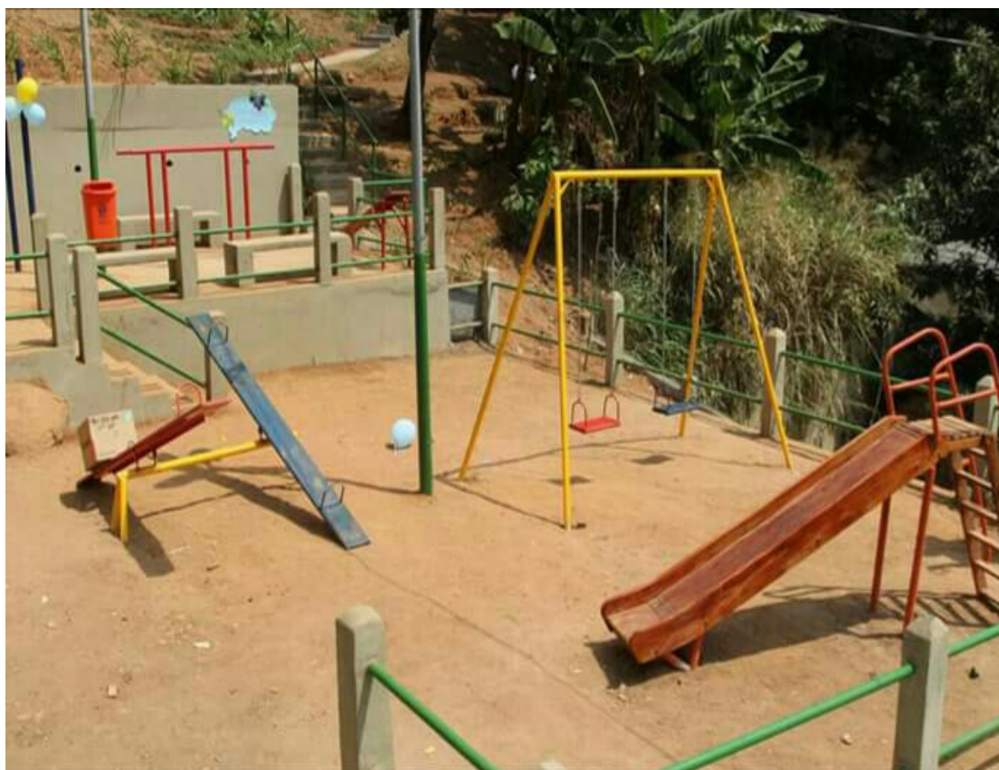
Foto 7: Praça Zé Flamengo está com os brinquedos/equipamentos conservados.

balanço duplo, uma gangorra dupla, um escorrega e oito bancos. Em seu entorno há sete árvores. Os brinquedos estão conservados por conta do desuso pelas crianças. Foram observadas atividades ilícitas durante o dia e a noite. Por conta disso, as crianças não frequentam essa praça. Não é acessível por pessoas portadoras de deficiência e nem por idosos por haver muitas escadas, não tem portão de acesso, o espaço não é gradeado, dificultando o aproveitamento desse espaço de lazer pelas crianças. A iluminação é ótima, o que, em tese, possibilitaria o acesso em diferentes horários. O poder público não atua nesses espaços (MELO; JESUS & BEZERRA, 2016, p.24) realizando a manutenção dos brinquedos/equipamentos e limpeza local. Não há segurança para os moradores, muito menos para as crianças, tanto que evitam a utilização desse espaço. Se formos fazer uma comparação com as praças de Copacabana, que constam com segurança e limpeza urbana, inclusive no que se refere ao cercamento ou não dos parques e praças (MELO; JESUS & BEZERRA, 2016, p.7), as praças do morro da Formiga são espaços bem precários.