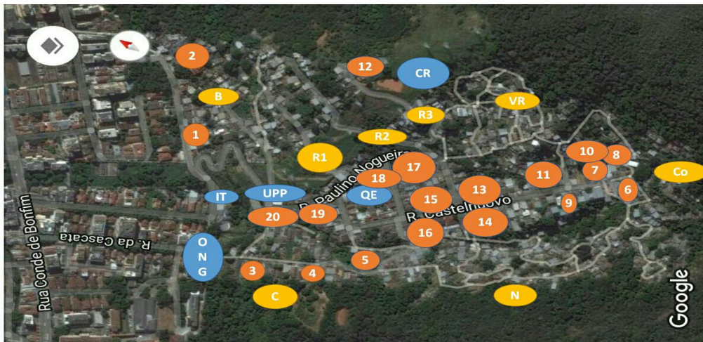
Foto 8: Localização dos bares (20); Campo Raia (CR); Quadra de esportes (QE);

Império da Tijuca (IT); Unidade de Polícia Pacificadora (UPP); ONG; Setores: Bazanha (B); Cascata (C); Niteroizinho (N); Coruja (Co); Rua 1 (R1); Rua 2 (R2); Rua 3 (R3) e Vila Rica (VR).