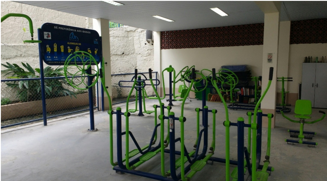
Foto 9: Como podemos ver na foto tirada no dia 27/12/2017, equipamentos conservados.

Também existe um campo de terra batida, mais conhecido como Raia, localizado na Rua 3, onde ocorre o Torneio de Futebol da Formiga. Não tem data específica para realização do torneio, mas normalmente acontece de três em três meses com as crianças e jovens/adultos aos finais de semana. O treino das crianças ocorre aos sábados e dos jovens/adultos aos domingos. Este torneio é organizado por dois moradores do Morro da Formiga, não há taxa de inscrição e nem cobrança de mensalidades. Há amistosos contra times de outras localidades.