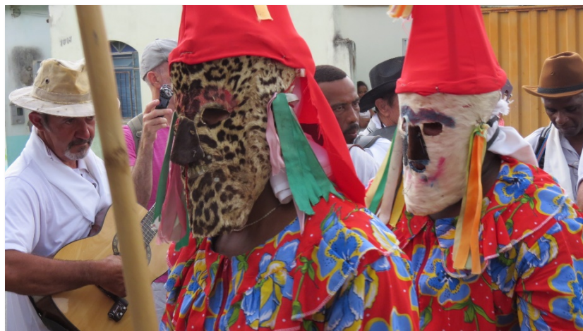
Palhaços no o ritual da Folia de Reis