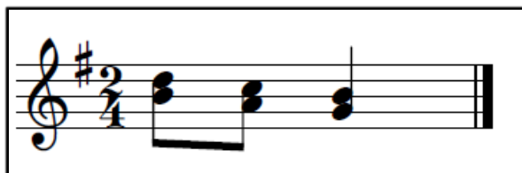
Frase do acordeon de 8 baixos para entrada do coro de foliões

No acontecimento da performance junto a emoção dos foliões, expresso em danças e cantos, os embaixadores contam e confiam também na marcação e levada rítmica dos caixeiros, que deve estar de acordo com o acordeon. A sanfona ocupa a frente da folia ao lado dos embaixadores e bem atrás estão as caixas. Os caixeiros não podem vacilar na batida certa, porque o andamento quem mantém são as caixas e para cada embaixador o andamento rítmico tem diferenças. No coletivo dessa prática as caixas exercem seu papel mediando as relações entre ritmo e melodia e como narra os foliões, sem vacilar, pois, uma caixa fora do ritmo pode desequilibrar toda a música.