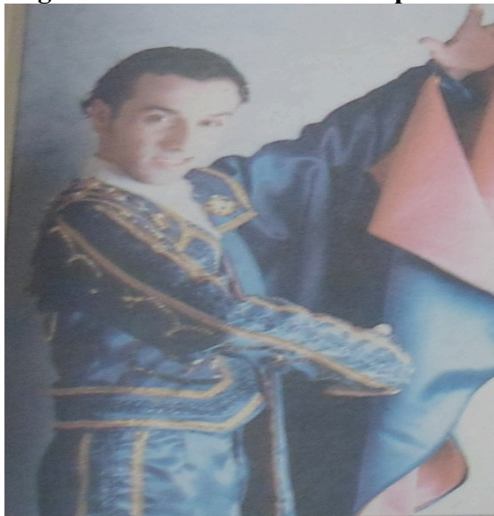
Imagem 1: Vientos de Arena Grupo Ahinco

Segundo Alves (2000) o espetáculo Bodas de Sangue conta a história de uma jovem camponesa chamada García Lorca, que no dia do seu casamento foge com outro homem e, então, o marido vai atrás dos amantes para horar o seu nome.