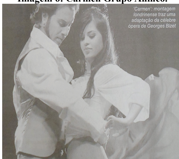
Imagem 6: Carmén Grupo Ahinco.

Carmén: O espetáculo retratou uma obra de grande importância para a Dança Flamenca, contando a história de uma linda cigana que encantava os homens. O espetáculo buscou mostrar o arquétipo das mulheres fortes e sedutoras, do feminino selvagem e da inteligência instintiva. Essas características femininas são apresentadas na imagem 5, onde se observa uma sedução no olhar da bailarina, uma postura que remete força sem perder o encanto da mulher (SATO, 10 out. 2008).