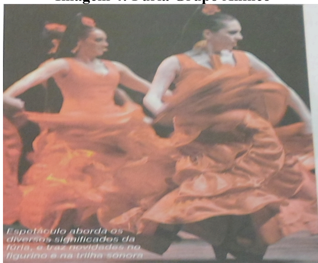
Imagem 4: Fúria Grupo Ahinco