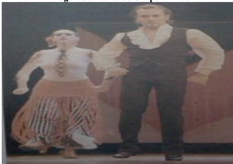
Imagem 5: Flamenco Grupo Ahinco

Flamenco: Este espetáculo apresentou uma mistura das raízes das danças de Andaluzia com elementos mais atuais, tendo como objetivo passar ao público uma dança mais moderna.