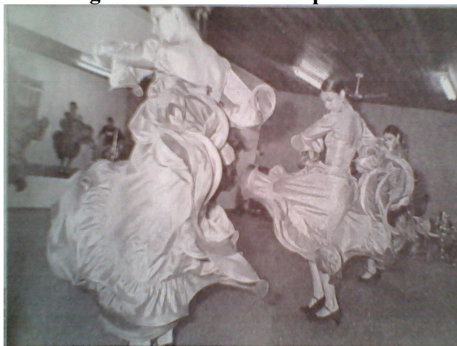
Imagem 2: Tormentos Grupo Ahinco.

Como podemos observar na imagem 2, o movimento da cabeça está acompanhando o momento do sapateado, caracterizando uma técnica da Dança Flamenca. Libâneo, (1999); Caserta, (2008); Braga, (2010) citam que movimento da cabeça exige que o sapateado a acompanhe, eles estão sempre interligados, é a parte onde há maior concentração, a cabeça pode se movimentar tanto da direita para esquerda como vice-versa. O Sapateado é composto por quatro movimentos básicos; Golpe (bater os pés inteiros no chão); Planta (bater os metatarsos no chão); Taco (bater os calcanhares no chão) e punta (bater a ponta do sapato no chão).