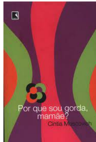
MOSCOVICH, Cíntia. Por que sou gorda, mamãe? Rio de Janeiro: Record, 2006.