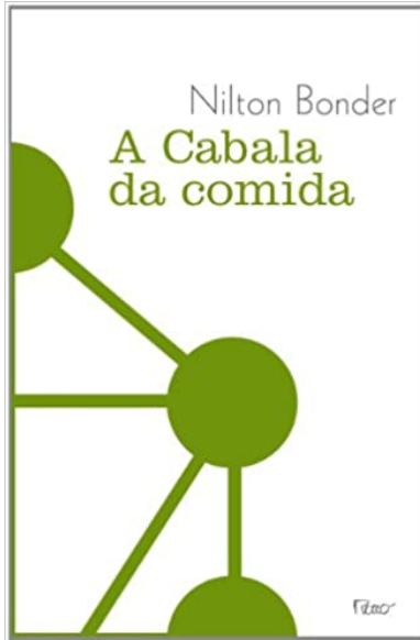
BONDER, Nilton. A cabala da comida . Rio de Janeiro: Rocco, 2010.