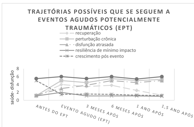
Figura 2. Gráfico adaptado de Bonanno e Diminich (2013).

A primeira figura mostra a trajetória de resiliência emergente, cujo bom resultado “emerge” após o cessar das condições adversas. Apresenta também as possibilidades da disfunção crônica, que não muda muito após o fim das adversidades; e da resistência ao estresse, que representa uma trajetória de saúde estável ao longo do tempo examinado, ou seja, em tempos de adversidades ou não, o sujeito mantém-se funcional e saudável.