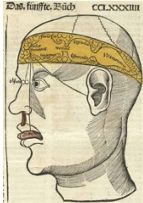
ilustración medieval de los sentidos internos (reich, 1503: 504)

Ahora, como lo revisamos, la teoría duró hasta 1543 en que se publicó el De humanis corpori fabrica , de Andreas Vesalius en donde se pueden encontrar las láminas siguientes: