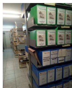
Figura 2: Acervo da Hemeroteca