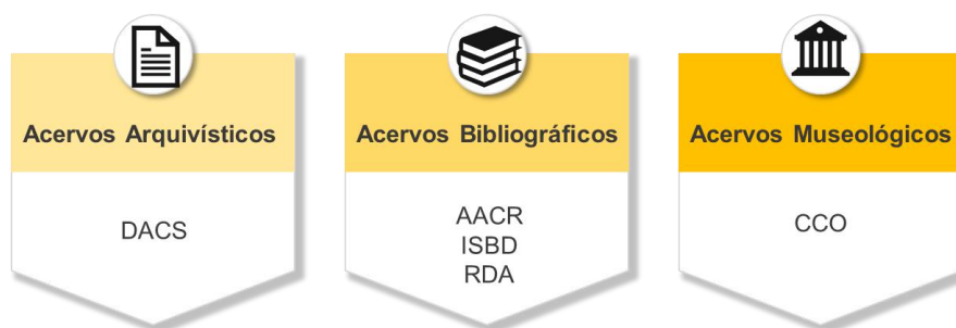
Figura 3 – Metadados de conteúdo para acervos culturais.

Os metadados de conteúdo descrevem as regras a serem seguidas para o preenchimento dos elementos do esquema de metadados escolhido. No domínio bibliográfico podem ser citados como exemplos o Anglo-American Cataloguing Rules (AACR) , o Resource Description and Access (RDA) e o International Standard Bibliographic Description (ISBD) , enquanto o Describing Archives: A Content Standard (DACS) se encontra no domínio arquivístico e o Cataloging Cultural Objects (CCO) se destina a objetos culturais em geral, conforme o esquema presente na Figura 3.