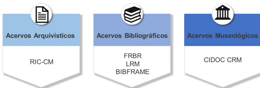
Figura 1. Modelos conceituais para acervos culturais.

Os modelos conceituais disponíveis no campo cultural cumprem esse objetivo: propor estruturas conceituais que podem ser contempladas em seus vários aspectos. Nesse sentido, é altamente recomendável (embora não obrigatório) que uma instituição inicie seu processo de decisão sobre padrões de metadados consultando esses documentos e refletindo sobre a natureza, características e especificidade do acervo. Existem modelos para acervos arquivísticos, bibliográficos e museológicos, conforme a Figura 1.