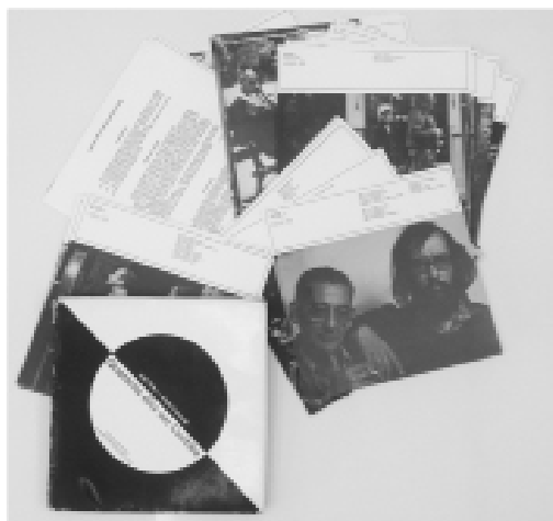
Figura 1 - Quarenta Clics em Curitiba

Um poeta Maior curitibano, louco para botar seu bloco na rua, apenas com uma hermética obra na praça por ele próprio editada (Catatau - 1974). Um famoso fotógrafo do eixo Rio/São Paulo – Jornal do Brasil, Manchete, etc – vindo morar em Curitiba, por obra do destino. Um editor/ em projeto, louco pela obra dos amigos tresloucados, que se propõe a divulgá-los, à qualquer custo (MELLO apud LEMINSKI, 1990) 14 .