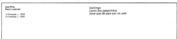
Figura 4 - Reprodução da prancha com o haikai: