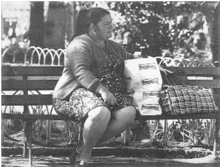
Domingo/Canto dos passarinhos/Doce que dá pra por no café (LEMINSKI; PIRES, 1990)