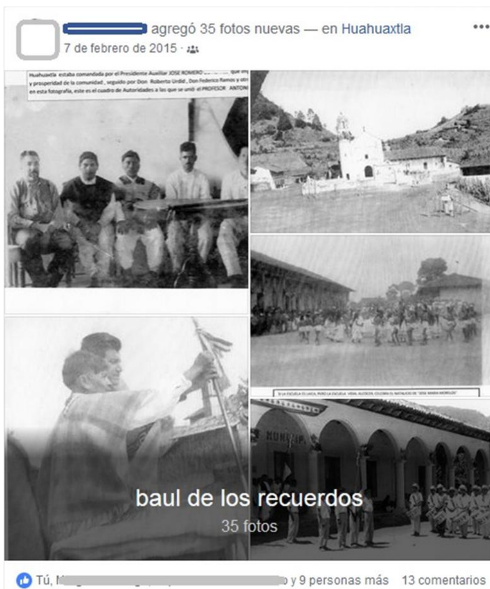
Imagen 1. Referentes del pasado, serie de fotografías antiguas.