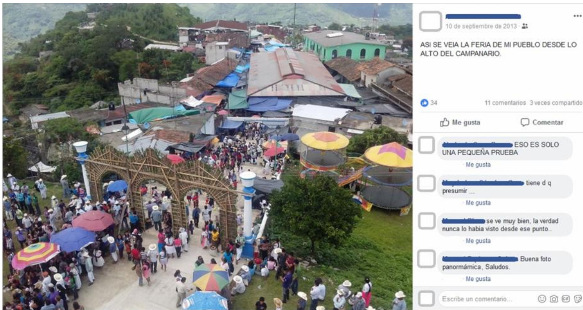
Imagen 2. Panorámica hacia el mercado y la feria.