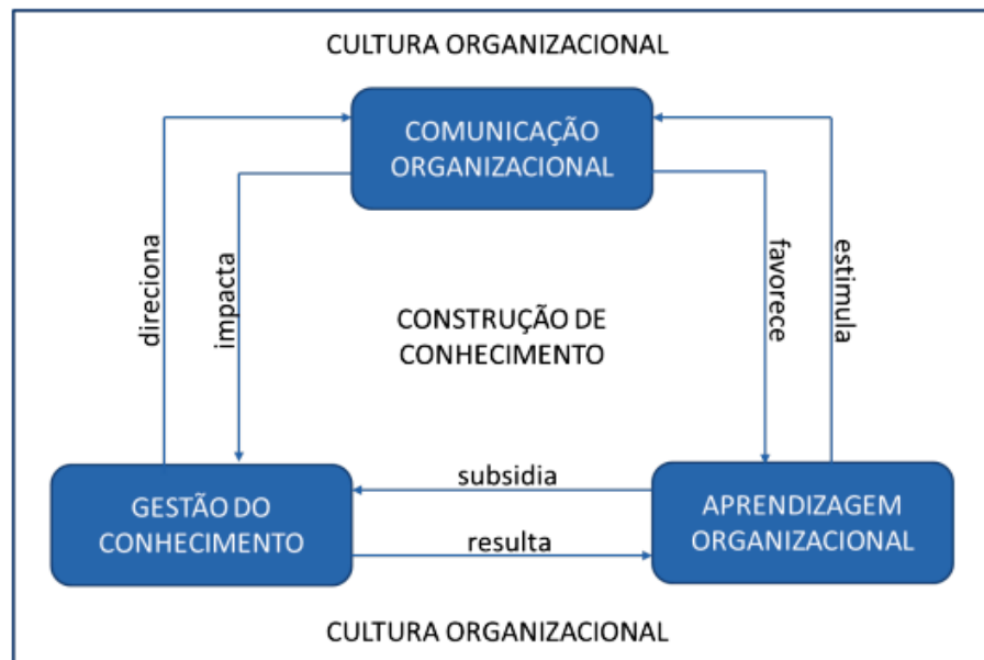
Figura 3 – Elementos dos espaços de Construção de Conhecimento nas organizações