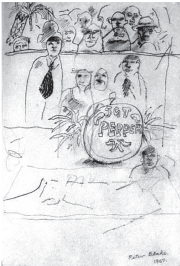
Ex.1 – Rascunho original de Peter Blake com a ideia da capa do disco Sgt. Pepper's Lonely Hearts Club Band dos Beatles (BEATLES, 1967/1987, p.8).