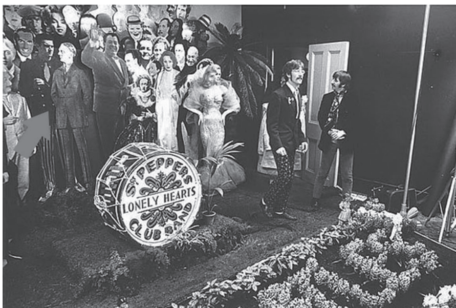
Ex.2 – John Lennon e Ringo Star no cenário quase pronto para a sessão de fotos da capa do disco Sgt. Pepper's Lonely Hearts Club Band dos Beatles em foto de Michael Cooper. Observe a foto de Hitler em posição à esquerda, mas que não aparece na foto final por ter ficado atrás dos Beatles (BEATLES, 1967/1987, p.9).

A batalha final ficou conta dos créditos. Primeiro, Paul disse: 'Sem créditos!' Então Robert Fraser persuadiu Paul a reconhecer o trabalho de Peter Blake e Michael Cooper. 10 No final, ninguém foi mencionado, exceto George Martin, embora dezenas de músicos, técnicos e assistentes contribuíram com o projeto. 'Paul é muito mesquinho quando se trata de créditos', explicou Fraser, 'porque ele quer passar a ideia de que ele faz tudo sozinho.' Não estaria longe o dia em que esta percepção seria correta."