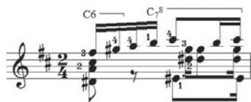
Ex.15 - Enigma , de Anibal Augusto Sardinha (Garoto) (c.24)