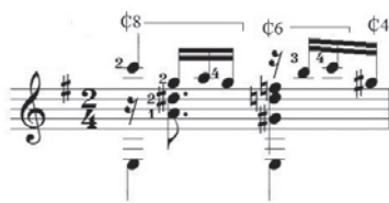
Ex.3 - Choro Triste nº. 2 , de Aníbal Augusto Sardinha (Garoto): exemplo de pestana com o dedo 2 e de pestana de falange (c.12)