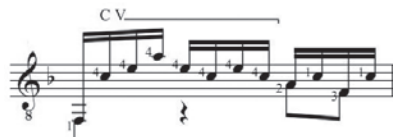
Ex.5 - Prelúdio em Ré Menor (BWV999) , de J. S. Bach: exemplo de pestana com o dedo 4 (c.15)