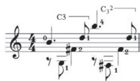
Ex.16 - Prelúdio , da Cavatina , de Alexandre Tansman (c.34)

O primeiro caso pode ser feito tanto com o pulso inativo 4 , afastando o cotovelo do corpo para que o dedo possa ser angulado, quanto com o pulso ativo, sendo sua articulação a responsável por posicionar o dedo no lugar requerido. O segundo caso depende exclusivamente da movimentação do braço.