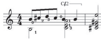
Ex.8 - Solemne , da Fantasia III , de Maurício Orosco (c.22)