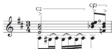
Ex.7 - Estudo nº. 3 , de Heitor Villa-Lobos (c.21)

intermediárias sejam pressionadas sem que isto afete as cordas mais agudas, que podem estar soltas.