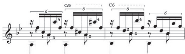
Ex.13 - Estudo n.º 13 , op. 29, de Fernando Sor (c.17 e 18)