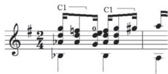
Ex.12 - Choros n.º 1 , de Heitor Villa-Lobos (c.13)