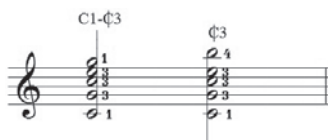
Ex.4 - Pestanas com o dedo 3