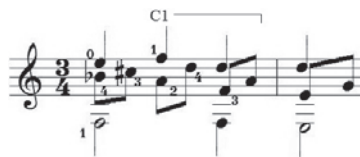
Ex.11 - Lição n.º 13 , op. 31, de Fernando Sor (c.46)