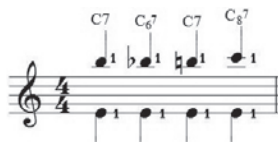
Ex.14 - Exercício para pestanas cruzadas. As pestanas com a ponta do dedo à frente podem ser executadas alternadamente com pulso ativo e inativo.