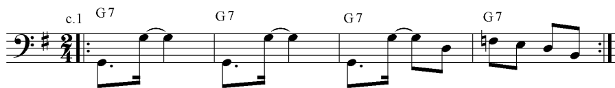
Ex.1 - Introdução simplificada de Pro Zeca de Victor Assis Brasil: lead sheet anônima.

A lead sheet baseada na gravação de Victor Assis Brasil (publicada integralmente neste volume de Per Musi ) é em Sol e traz uma introdução ampliada, de 23 compassos (Ex.3), mais elaborada do que as outras do ponto de vista formal, melódico e harmônico, constituindo uma seção autônoma. Essa introdução é dividida entre os dois estilos: jazzístico nos 15 primeiros compassos e no estilo do baião nos 8 compassos finais. As progressões harmônicas