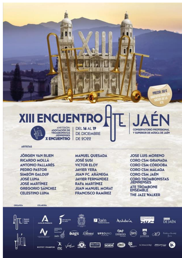
Imagen 1 – Cartel promocional del XIII Encuentro ATE ( https://trombonistas.net/?page_id=109 )

Más recientemente, en el XII encuentro, celebrado en Biar (Alicante) en 2022, participó el Coro de Trombones del Conservatorio Superior de Música de Murcia ; y en el XIII encuentro, llevado a cabo en Jaén ese mismo año, intervinieron el Coro de Trombonistas Jiennenses y los coros de los conservatorios de Córdoba, Granada, Málaga y Jaén.