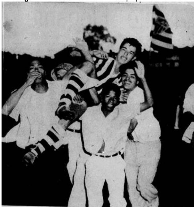
Imagem 4 - Torcedores invadem campo para comemorar