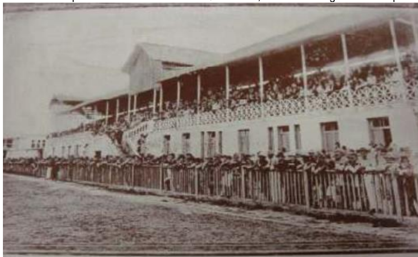
Imagem 1 – Foto da partida entre o América e o Queluziano, notando-se a geral e as arquibancadas.