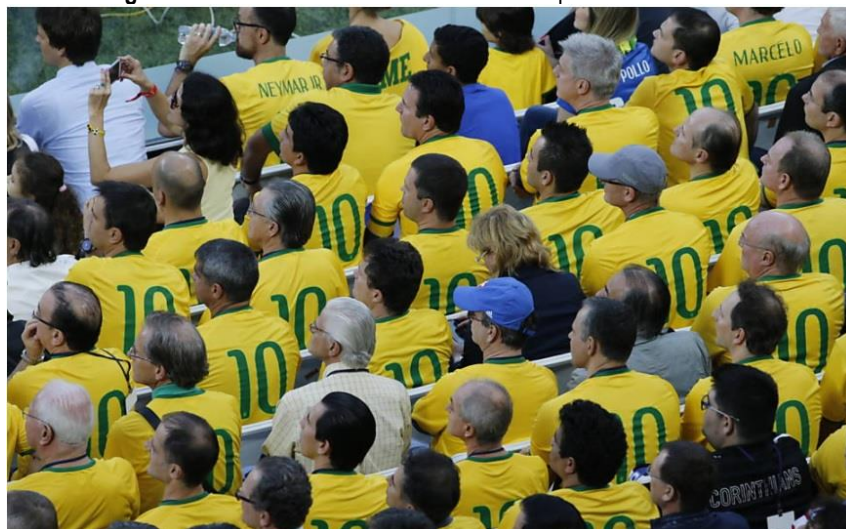
Imagem 11 – Torcedores do Brasil durante a Copa do Mundo de 2014