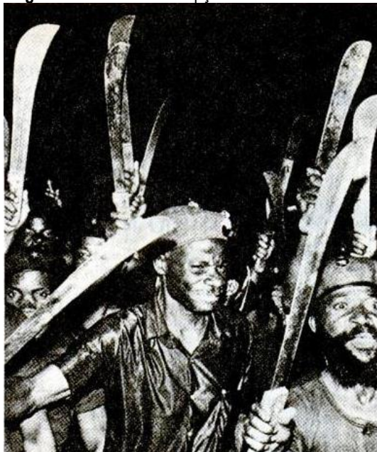
Imagem 7 - “Comitê de recepção do estádio Fonte Nova