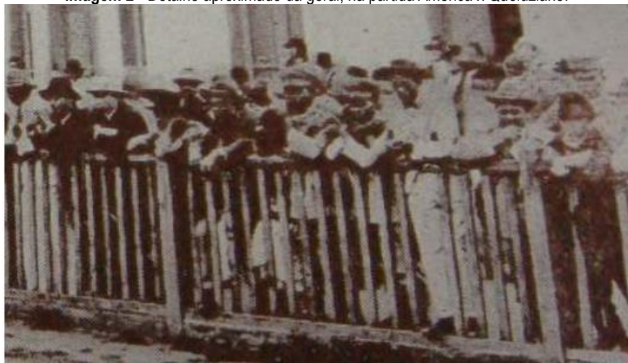
Imagem 2 - Detalhe aproximado da geral, na partida America x Queluziano.