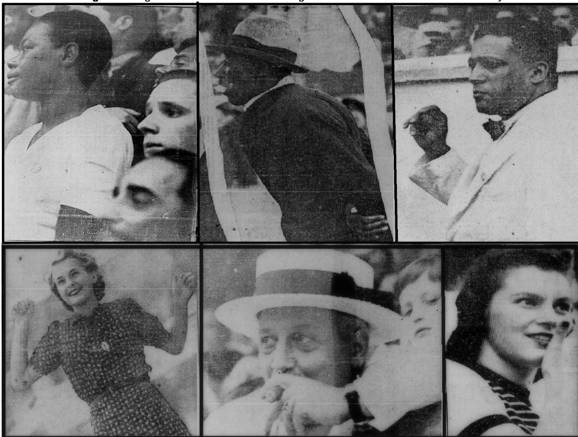
Imagem 3 - Algumas fotos dos torcedores negros em matérias da série “Como eu torço”