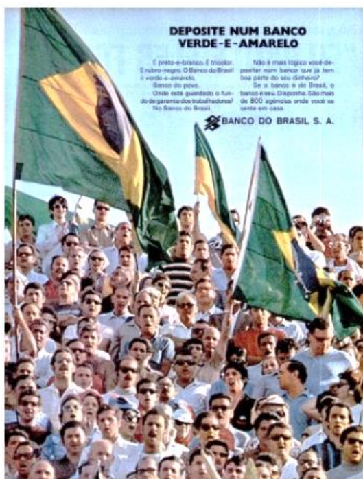
Imagem 5 - Torcedores em campanha publicitária do Banco do Brasil