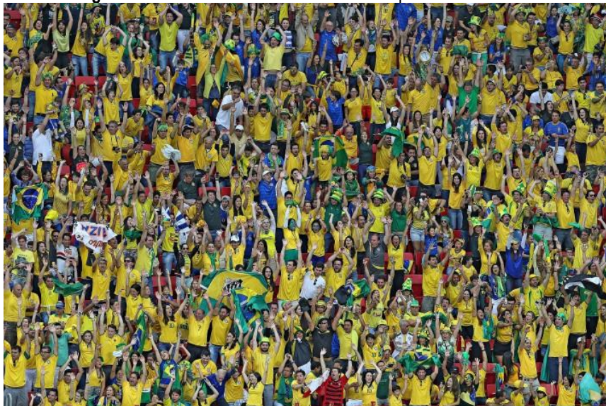
Imagem 10 – Torcedores do Brasil durante a Copa do Mundo de 2014