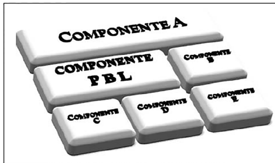
Figura 2 – Recorte transversal de um currículo com implantação parcial de PBL

O PBL também tem sido implantado como um modelo parcial, ou seja, num componente (ou mais) dentro de um currículo convencional, como ilustrado na Figura 2. Nesse caso, um conjunto de problemas é utilizado para introduzir, estruturar e aprofundar os conteúdos desse componente. Os conteúdos dos demais componentes (A, B, C e D) são trabalhados separadamente, empregando-se metodologias convencionais, e desvinculados dos problemas apresentados no componente PBL. A principal limitação desse modelo está na probabilidade de vários componentes competirem pela atenção e pelos esforços dos alunos, especialmente em razão dos diferentes ritmos de ensino e sistemáticas de avaliação de desempenho discente. Ademais, a capacidade integrativa do PBL pode ficar comprometida com respeito aos conteúdos trabalhados nos demais componentes do currículo.