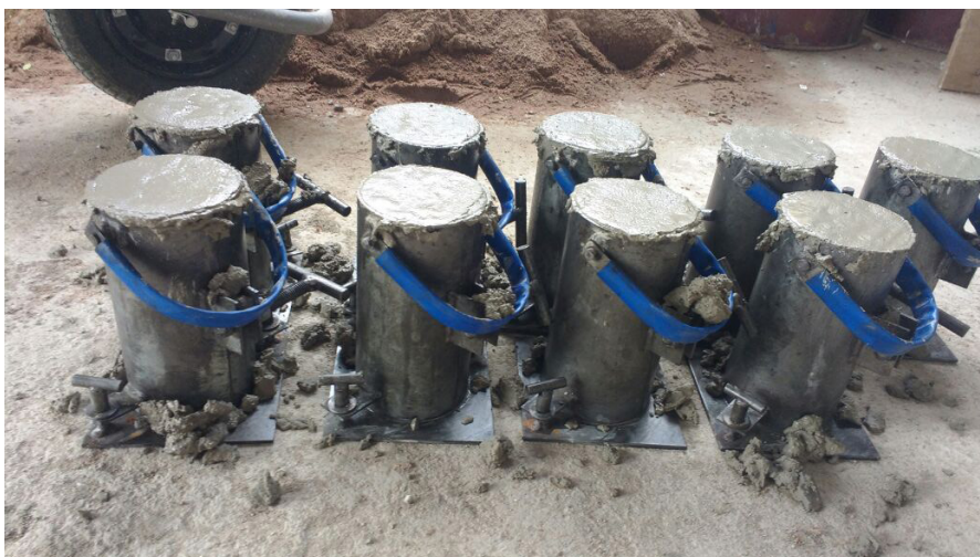
Figura 1 – Corpos de prova dentro dos respectivos moldes

Na segunda etapa, percebeu-se o engajamento dos alunos na apresentação de dados e fotos de seus testes, bem como na explicação ativa de como foi a experiência inicial e como tinha sido para eles a primeira feitura do concreto (FILHO, 2017).