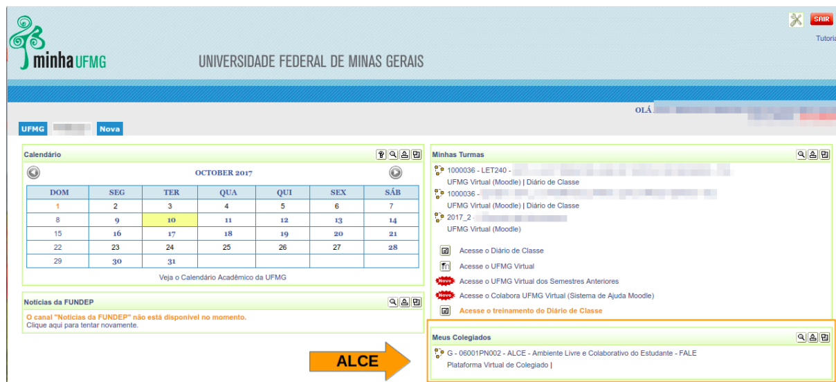
Figura 1 – localização do ambiente ALCE no espaço MinhaUFMG.