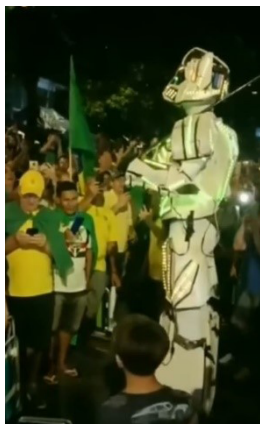
Figura 6 – Misticismo heroico