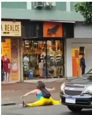
Figura 10 – Contorcionismo