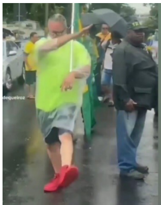
Figura 8 – Marcha do ressentimento