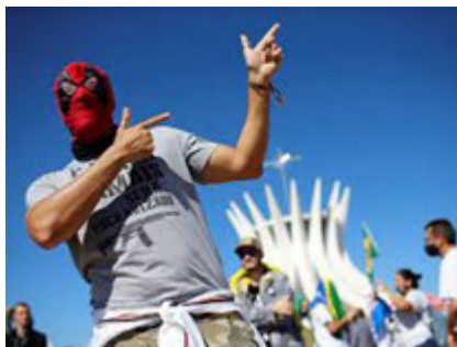
Figura 7 – Mão feito arma

impuro e apenas uma morada passageira até que se consiga a morada plena e eterna no plano idealizado.