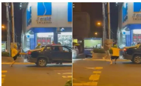
Figura 2 – Chutar carro petista