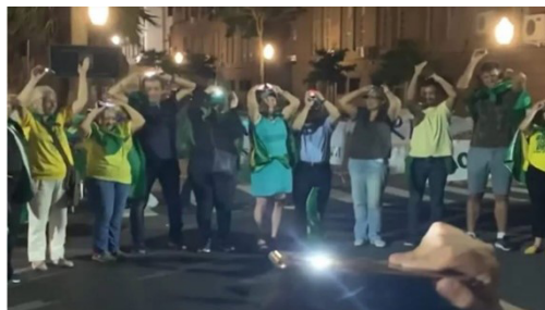
Figura 4 – Celular aos céus