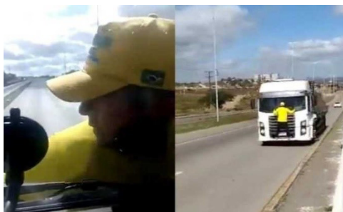
Figura 1 – Homem e caminhão

mesmo hábito de manifestar com o corpo, porém sem a ressignificação direta dos campos militares e religiosos. Assim dizendo, surgiram outros manifestantes que incorporaram as atitudes dos primeiros manifestantes, aqueles que ressignificavam recursos de linguagens dos campos militares e religiosos. Entretanto, essas mesmas atitudes (haja visto, atitude como formação muscular para a ação) geraram ações mais primitivas como tentar parar um caminhão com o próprio corpo preso a ele, Figura 1, chutar um veículo, Figura 2, cantar o hino nacional para um pneu, Figura 3 e posicionar o celular na cabeça, projetando-o para o céu, Figura 4.