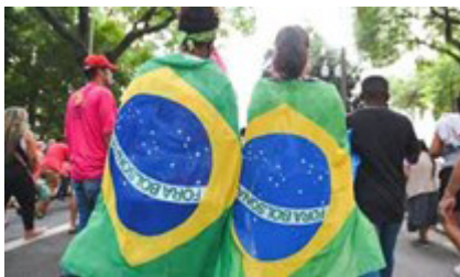
Figura 5 – Bandeira do Brasil

Portanto, pelo fato de inconscientemente lutarem contra o efeito gravitacional, os manifestantes estabelecem relações de forças que se manifestam em ações deles contra o ambiente, os objetos e os outros seres.