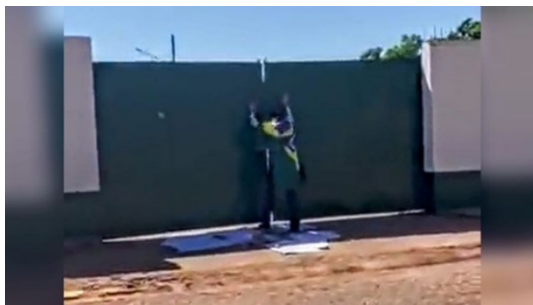
Figura 11 – Socar o portão do quartel

No seu movimentar, os manifestantes são mais estátuas do que bailarinas.