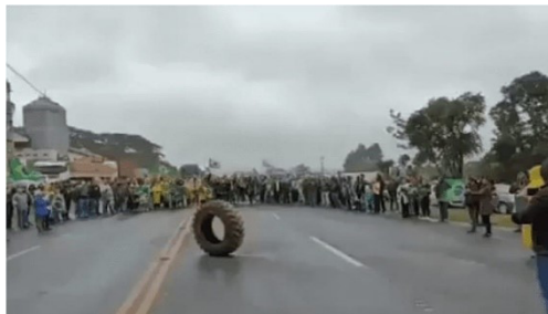
Figura 3 – Hino ao pneu