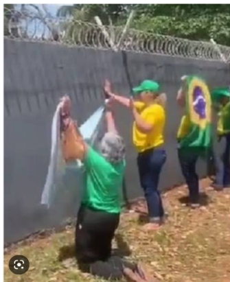
Figura 9 – Negação do corpo em movimento

Por isso que, em sua linguagem utilizada nas manifestações, eles buscam apoio nos muros dos quartéis, nos veículos, muitas vezes ajoelhados no chão em vez de em pé, Figura 9, realizando contorcionismos em meio aos carros, Figura 10, ou mesmo permanecendo estáticos por dias nas ruas diante dos quartéis. Ao negarem o movimento e o estar de pé por si próprios, eles negam que sejam corpo e se afirmam como entidades, que não pertencem ao mundo físico.