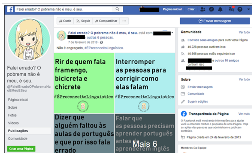
FIGURA 1 – Layout da página, com sua publicação fixa 10

Desde fevereiro de 2018, a página apresenta uma publicação fixa que já incitou mais de 21 mil compartilhamentos e mais de 4,1 mil comentários. Focalizamos, assim, os comentários, tomados como discurso, a partir dessa publicação, cuja legenda é “Não é engraçado, #ÉPreconceitoLinguístico”. Nela observamos (Figuras 1 e 2) nove imagens com dizeres de situações que, para os sujeitos-moderadores, configuram preconceito linguístico.