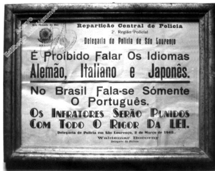
Fonte: Foto Acervo de Edilberto Luiz Hammes. Publicado em "Folha Pomerana" N° 231, 2018 – 17 de março de 2018. (Disponível em: https://jornalggn.com.br/historia/e-proibido-falar-italiano-alemao-e-japones/ . Acesso em: 17 abr. 2026)