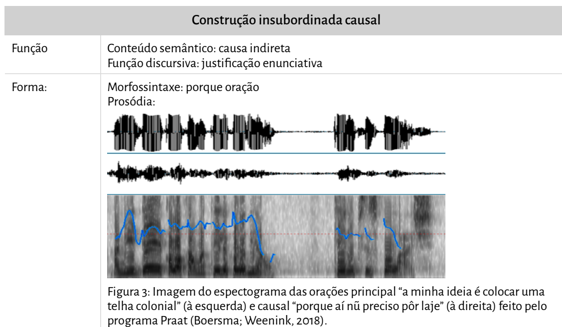
Quadro 2 – Forma e função da construção in subordinada causal