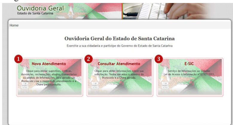
Figura 4 – Ouvidoria Geral do Estado de Santa Catarina