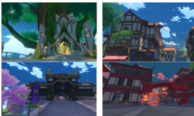
Figura 2 – Mosaico em sentido horário: Mondstadt, Liyue, Inazuma e Sumeru.