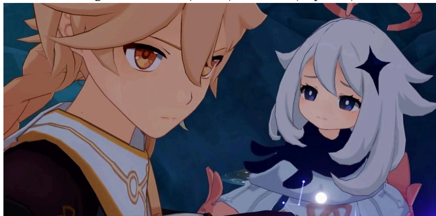
Figura 1 – Aether (direita) e Paimon (esquerda).

outro e se desdobra em várias histórias sequenciadas principais (denominadas “atos” ou “missão do arconte”), intercaladas por histórias paralelas (“missões de mundo”). O (a) protagonista tem como companheira Paimon, uma fada que auxilia nas missões, apesar de não ser um personagem jogável.