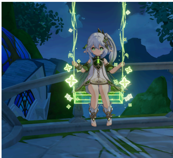
Figura 4 - Nahida.

samsara produzido por alguns dos sábios da Academia que visam roubar, através dos terminais Akasha, o sonho das pessoas para alimentar a base de dados do Akasha. Após descobrirem uma maneira de quebrar o ciclo do samsara, Aether e Nahida sofrem, no Ato III, uma emboscada dos sábios. Aether consegue escapar, mas Nahida é capturada.