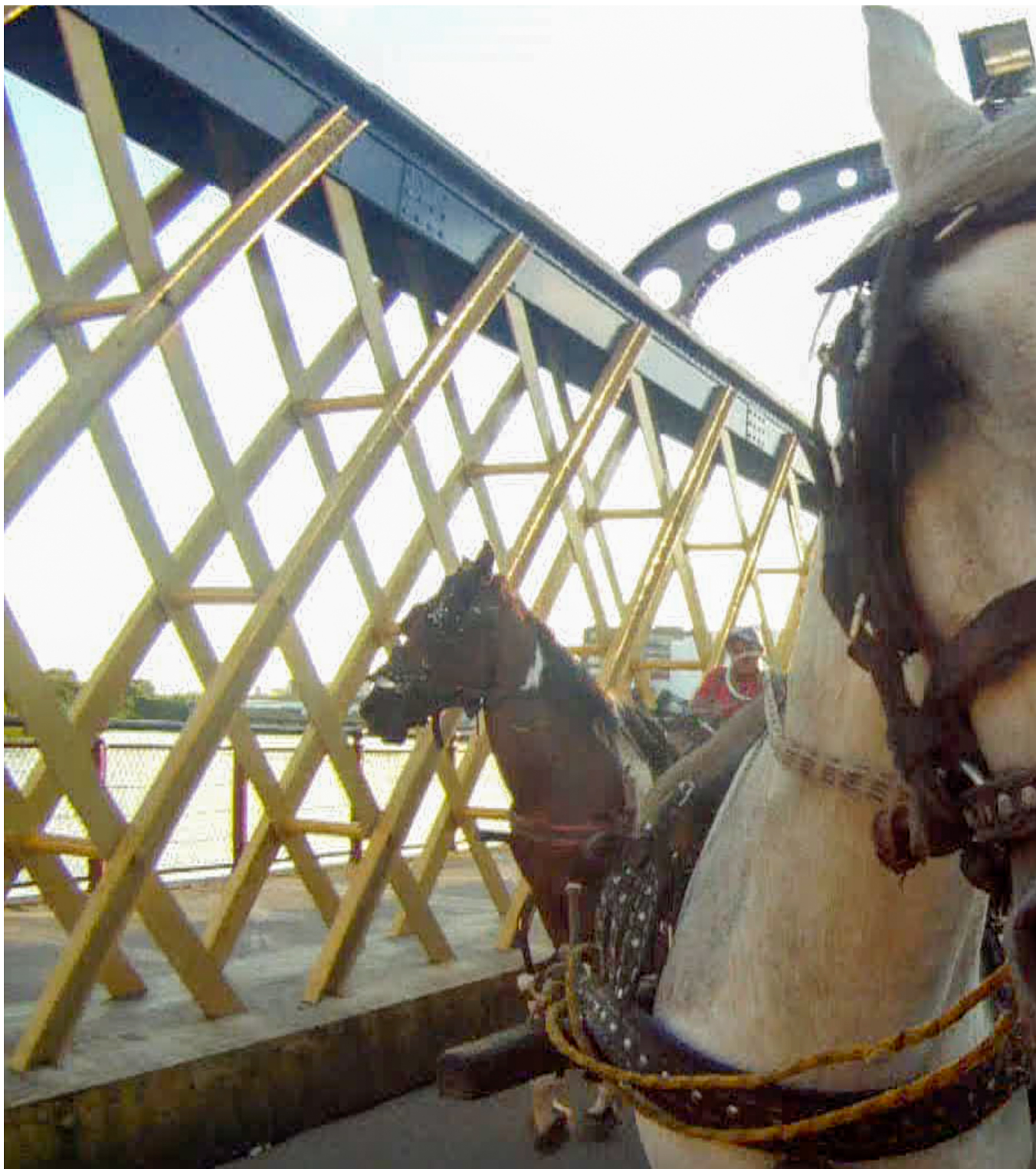
Jonathas de Andrade, O Levante (The uprising) - 2013. Jonathas de Andrade Vídeo - cor, som, 8 min, resolução: HD Video. Commissioned by Thyssen-Bornemisza Art Contemporary, in 2012.