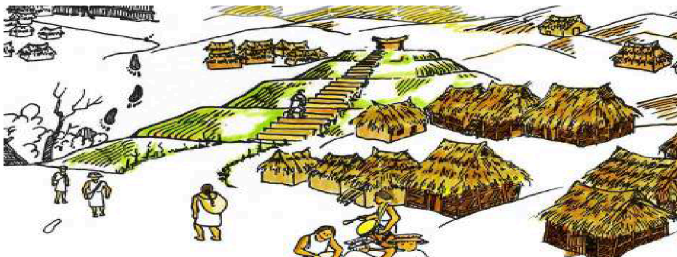
Ilustração 1. Pirâmide cerimonial, hoje Morro de Tulcán. Representação povo Nasa.