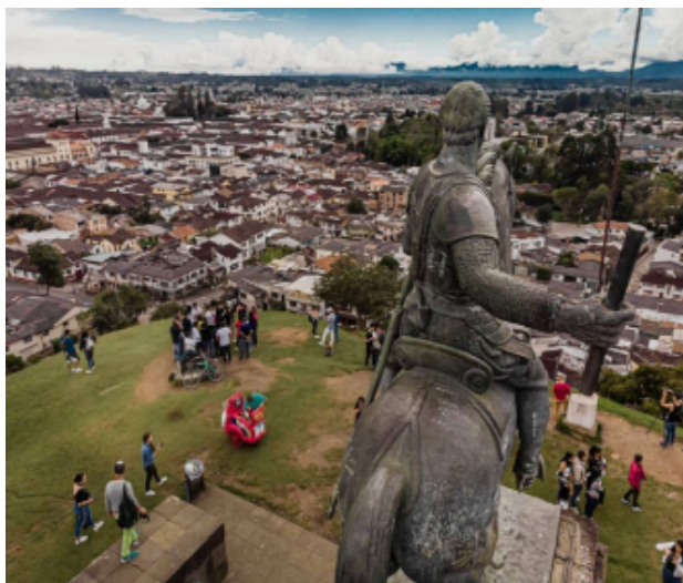
Foto 1. Estátua de Belalcázar.