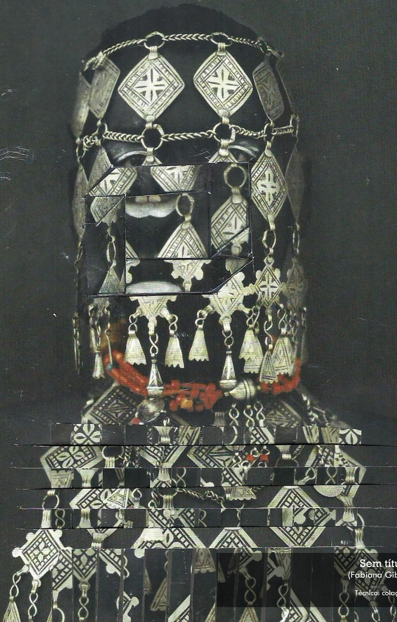
Sem título (Fabiana Gibim)