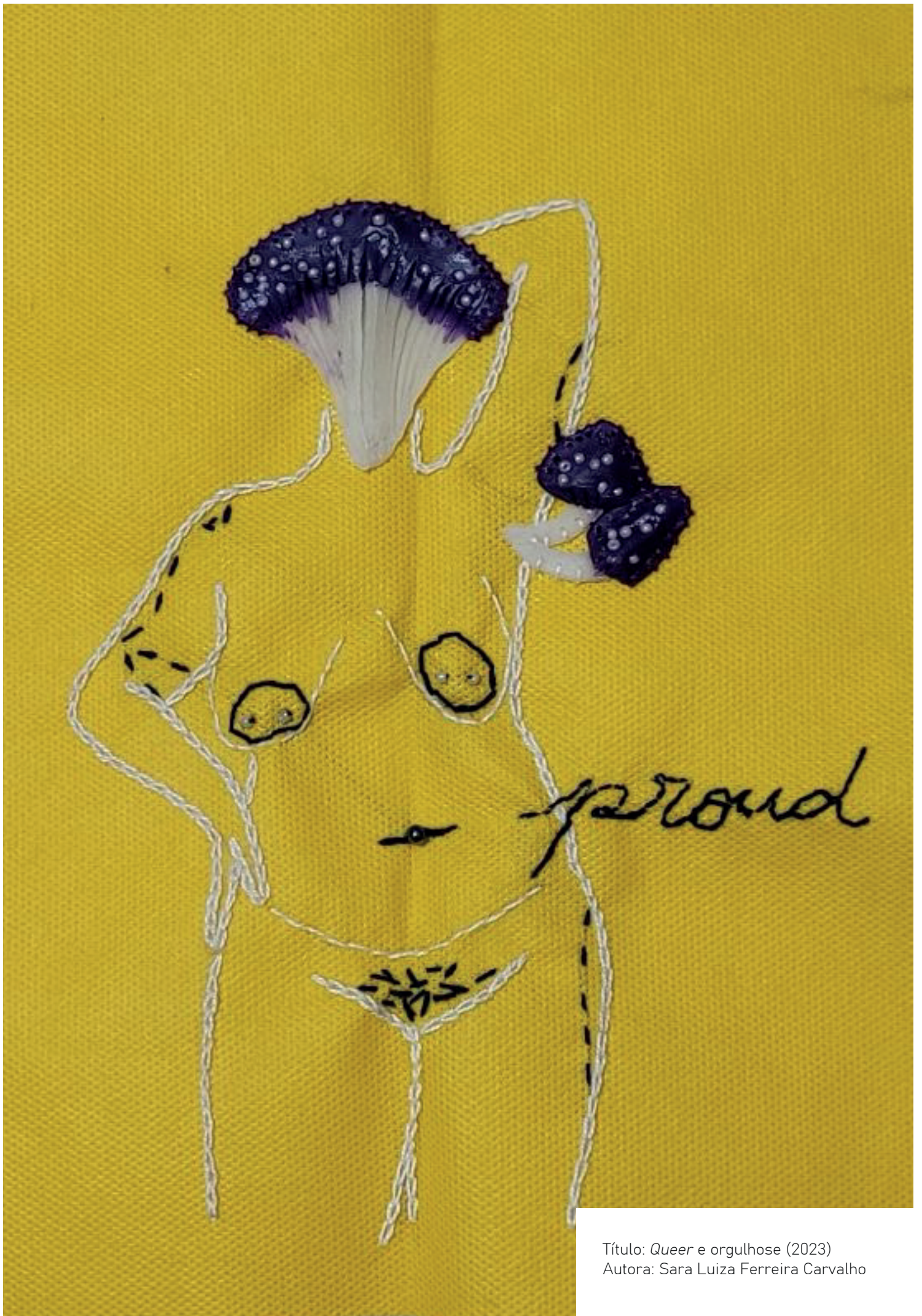
Título: Queer e orgulhoso (2023) Autora: Sara Luiza Ferreira Carvalho