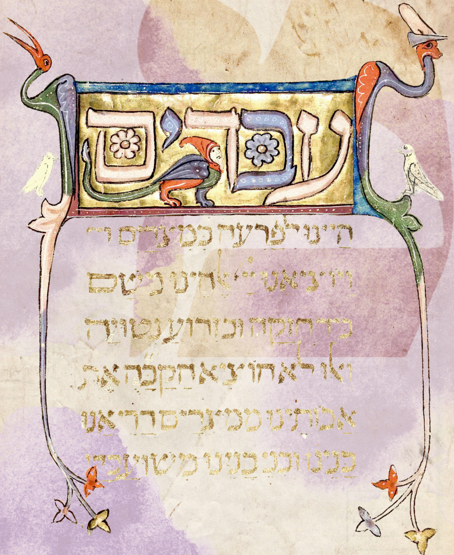
Ilustração do manuscrito Prato Haggadah (Espanha, 1300). Obra em domínio público. Composição visual remixada.