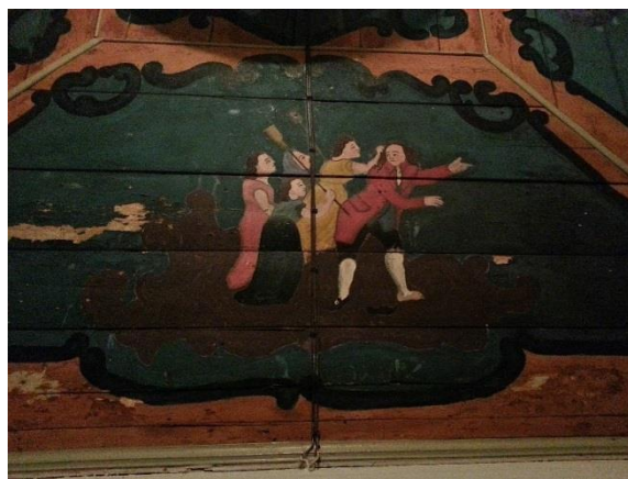
Figura 2. Fragmento da pintura tombada pelo IPHAN.

A pintura do forro é composta por tábuas lisas de madeira, conforme apresenta a figura 2, executada provavelmente em 1790 por autor desconhecido. Possui um quadro central e formas laterais em trapézio, formando um retângulo correspondente à área do forro. Os setores são delimitados por finos cordões de madeira e nas partes centrais possuem enquadramento por pinturas em elementos em volutas estilizadas (GOULART et al, 2007, p. 27).