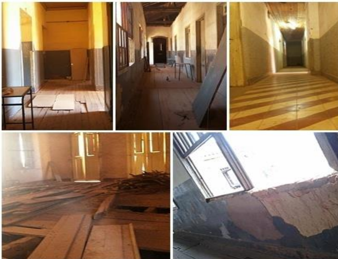
Figura 6. Interior do “São Joaquim”, parte anexada ao IPHAN (Os autores, 2016)

Desse modo, alunos e professores principalmente, foram à luta e instituíram o movimento “Resgatando o São Joaquim”.