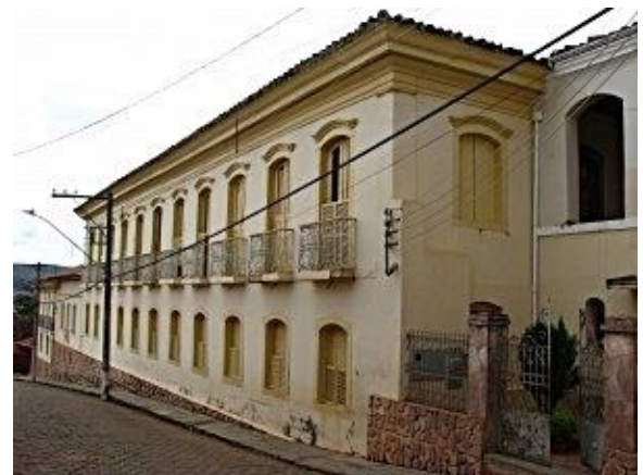
Figura 5. Edifício da E. E. “São Joaquim” (Conceição do Mato Dentro, 2010)

A estrutura primitiva da construção é em madeira e taipa de sebe. A cobertura é em telhado de quatro águas, que veio a ser reformado em meados de 2006. Os beirais guarnecidos de madeira conservam elementos bem característicos da arquitetura de feição colonial, descreve os historiadores da Fundação João Pinheiro (1978). O interior do prédio apresenta circulação central nos dois pavimentos, tanto no andar superior como inferior, permitindo acesso aos diversos cômodos do edifício. Grande parte das salas de aulas ficam no prédio anexo, que não é tombado pelo IPHAN (CONCEIÇÃO DO MATO DENTRO, 1999).