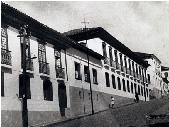
Figura 3. “Asilo São Joaquim”

Conceição do Mato Dentro é referência em cultura e patrimônio histórico. A cidade é um sítio histórico com várias construções coloniais e igrejas barrocas. Seu centro histórico conta com duas igrejas (Igreja Matriz de Nossa Senhora da Conceição e Igreja de Nossa Senhora do Rosário), Casa com teto pintado à Praça Dom Joaquim (Atual Escola Estadual São Joaquim, demonstrada na figura 3), Chafariz da Praça Dom Joaquim, que se destacam dentre os demais edifícios. Esses bens supracitados, são tombados pelo IPHAN, que ainda inclui as obras de talha do Santuário do Bom Jesus de Matozinhos (BRASIL, 2005, p. 129).