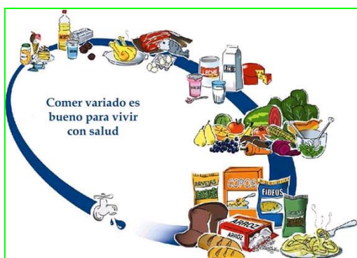
Figura 1 – Gráfica de la Alimentación Saludable

Se trabajó con escolares, familiares y personal de la escuela en talleres de cocina, feria de platos e intercambio oral de recetas de tradición familiar; espacios coordinados por el equipo PROCON y Voluntarios, desde la perspectiva de la teoría del Aprendizaje de Vygotsky (BAQUERO,1996).