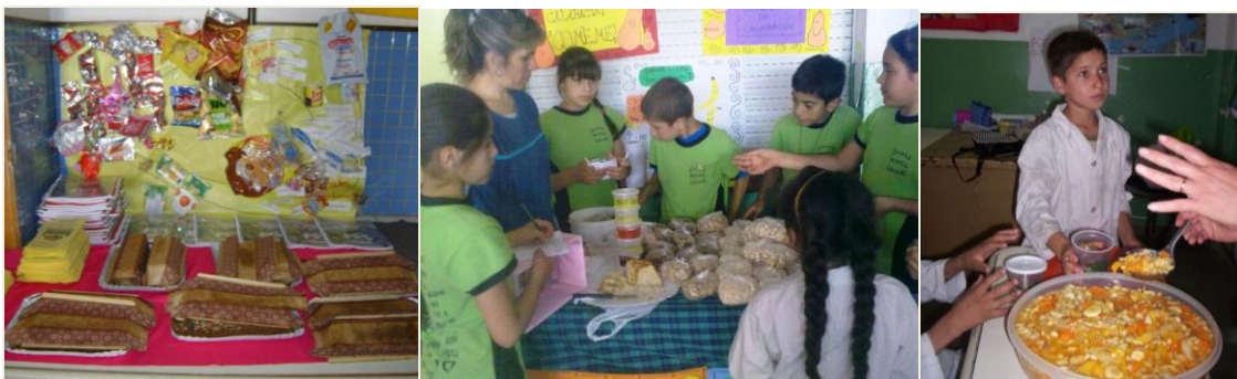
Figura 2 – Kiosco Saludable