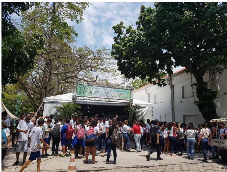
Figura 4 – Tenda SNCT montada – Primeiro dia do evento.