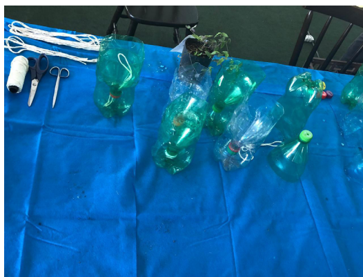
Figura 5 – Materiais para oficina, separados para o início da atividade.

Nota : a etapa final de colocação da água no vaso foi recomendada, mas não realizada na oficina. Por segurança, foi recomendado não estocar grande volume de água no stand da tenda SNCT, que era acarpetada e equipada com ar-condicionado e instalações elétricas. Além disso, houve preocupação em facilitar o transporte das mudas, que poderiam, inadvertidamente, espalhar a água no transporte.