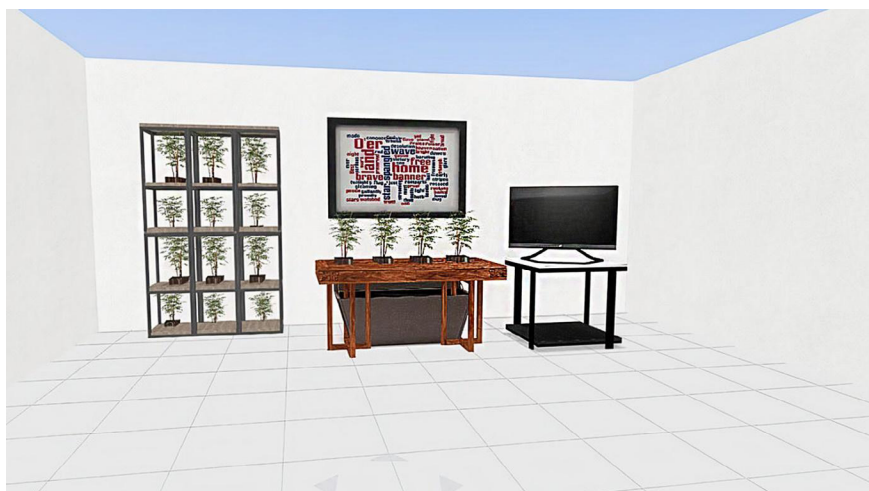
Figura 1 – Projeto inicial do stand.

Na fase de planejamento, os temas acima nortearam o discurso pensado para a interação na oficina, com objetivo de identificar oportunidades de diálogo e contextualização dos conteúdos de acordo com o perfil e os interesses do público visitante. Os mesmos princípios foram aplicados na produção dos materiais de apoio, comentados adiante. Nesta fase, o grupo dedicou-se ainda à elaboração do projeto de organização do stand (figuras 1 e 2), momento em que a equipe pensou nas necessidades e possibilidades para a acomodação do material da oficina. Posteriormente, essas ideias foram adequadas ao orçamento e ao padrão de mobiliário adotado pela estrutura maior do evento, organizado pelo Museu da Vida para a SNCT.