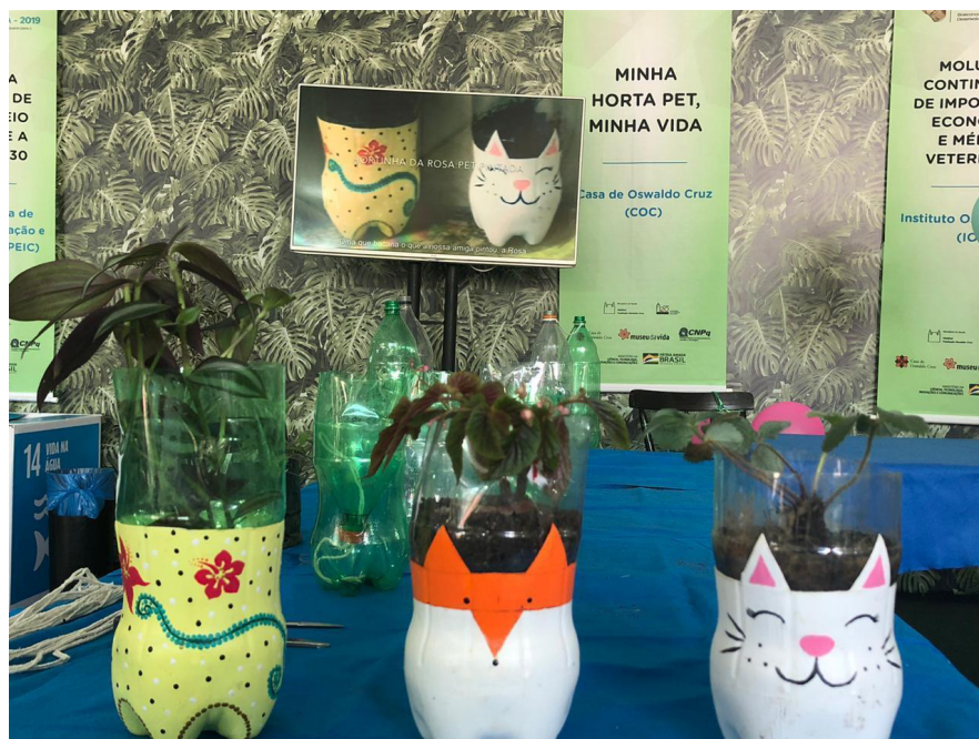
Figura 6 – Hortas montadas e pintadas. Ao fundo a TV exibindo o vídeo produzido e o banner do stand.

Uma opção apresentada para decoração da Horta PET Autoirrigável é decorar os vasos com formatos e cores variados através de pinturas ou recortes nas bordas. Antes da SNCT, foram produzidas, pelo grupo, hortas em formato de gatinhos e flores, utilizadas na decoração da mesa onde a oficina aconteceu (Figura 6).