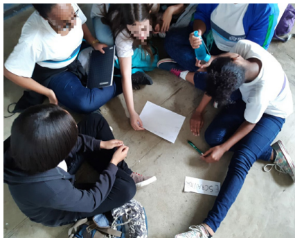
Figura 5 – Actividad Nube de Palabras