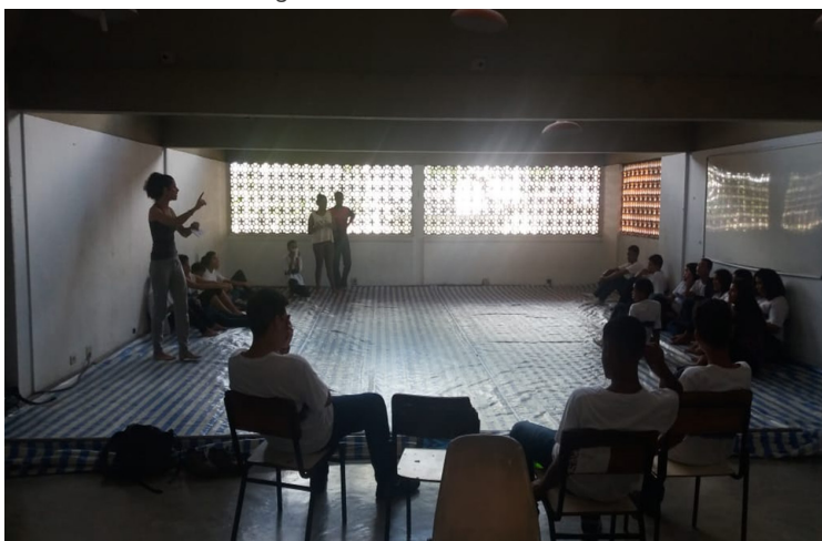
Figura 1 – Tribunal simulado

Introducimos el bloque de luchas con una actividad en la que simulamos una sala de audiencias para debatir luchas en la escuela; en este sentido, la clase se dividió en tres grupos llamados ataque, defensa y jurado. Los grupos de ataque y defensa debían formular tres argumentos para presentar al jurado que, en función del desarrollo de la discusión, terminaría con su veredicto.