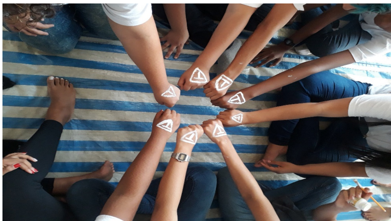
Figura 3 – Estudiantes y pinturas creadas por ellos/ellas.

elegir ese nombre, en honor a su amigo. (Diario de Campo Extensionista D, 2018).