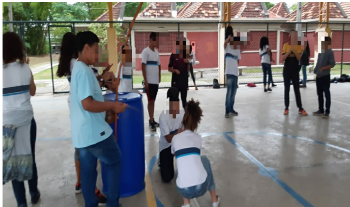
Figura 6 – Estudiantes y extensionistas durante experiencias de Capoeira