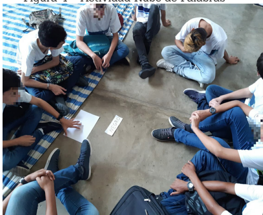
Figura 4 – Actividad Nube de Palabras

En esta línea, para introducir el contenido, realizamos la actividad Nube de Palabras de Palabras, que consistió en la formación de grupos, en un primer momento, y palabras como "negro", "lucha", "esclavitud" y "cultura" estaban repartidas por todo el piso y un representante de cada grupo debía ir al centro, tomar una de las palabras y volver a su grupo; juntos/as tendrían que hacer un esquema, en el que escribirían todo lo que pensaron al leer la palabra seleccionada.