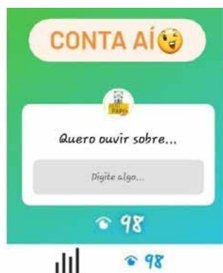
Figura 4 -Resultado de visualizações de uma postagem no Story