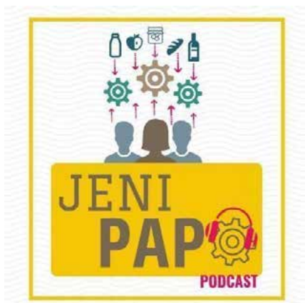
Figura 1 – Logomarca criada (à esquerda).